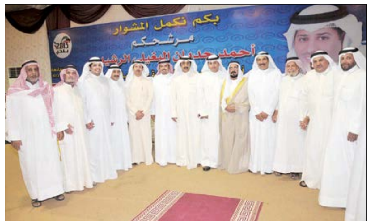
عدد من أبناء الدائرة السادسة يقدمون التهاني للبغيلي