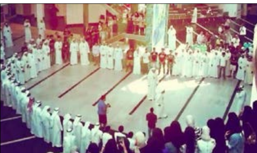
الجامعة استعدت للانتخابات