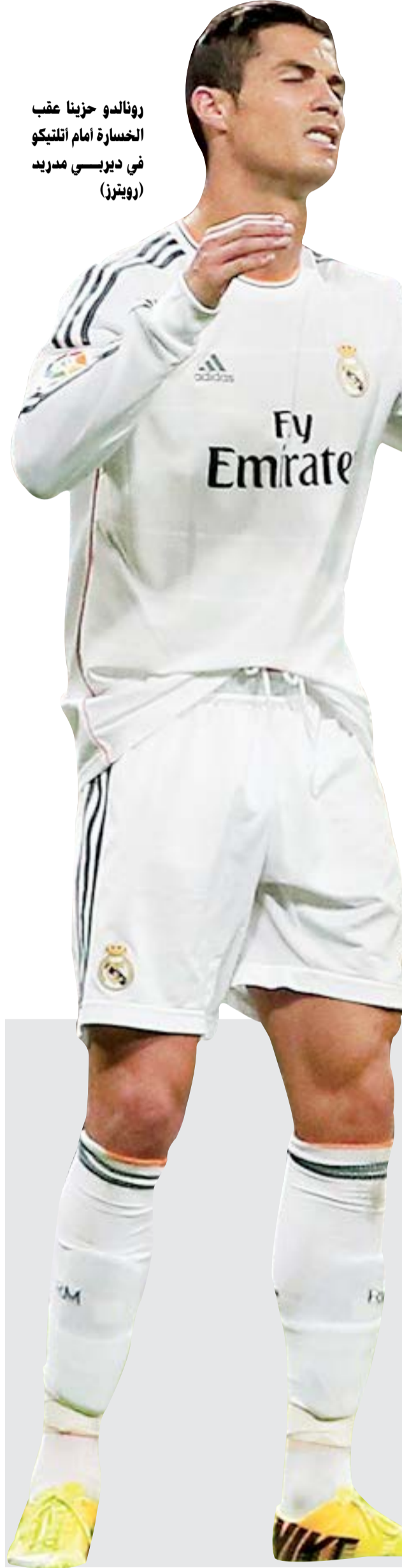
رونالدو حزينا عقب الخسارة أمام أتليتيكو في ديربي مدريد