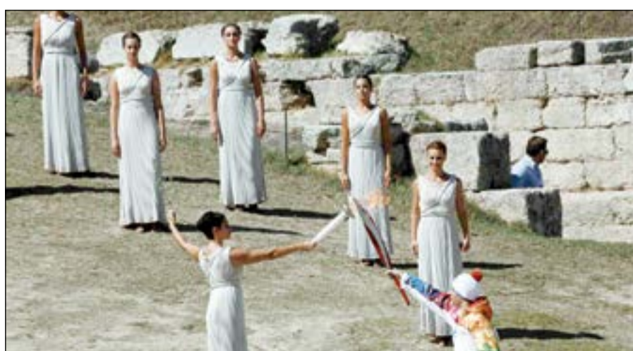
لحظة إضاءة شعلة أولمبياد سوتشي في معبد هيرا باليونان

من جهته، قال تشرنيشكو «الشعب الروسي فخور لاستقبال اهم رمز للحركة الاولمبية»، وستتم الشعلة في 20 بلدة يونانية قبل ان تصل في الخامس من أكتوبر لنقلها إلى روسيا.