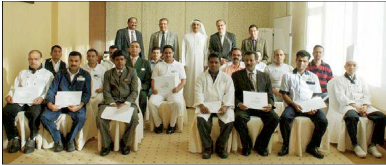
جانب من فعاليات الدورة الفندقية

ضمن البرامج التدريبية لموظفي الفندق قامت الإدارة بدورة تدريبية خاصة، وقد دايت إدارة شؤون الموظفين على الاهتمام بهذه الدورات وعلى عقد الحملات التوعوية داخل الفندق، وذلك تحت شعار «الارتقاء في خدمة العملاء». وقد شارك في الدورة العديد من موظفي الفندق في جميع الأقسام خاصة الموجودين في الفندق على مدار الساعة. والجدير بالذكر ان مثل هذه التدريبات تلقى إقبالاً شديداً لدى موظفي الفندق لما فيها من أهمية ومساندة لمواكبة التطور والإبداع في الصناع الفندقية.