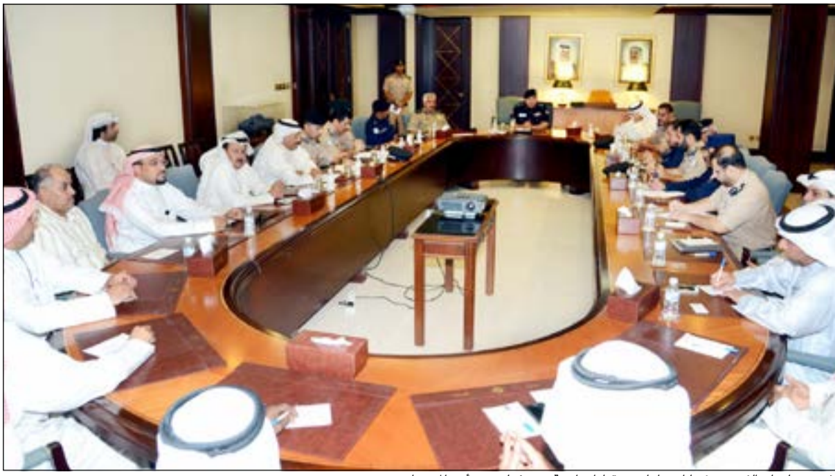
الفريق سليمان الفهد مترشدا اجتماعاً ضم قيادات أمنية ومسؤولين عن أمن المجمعات