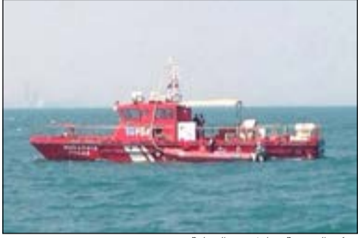
مركز الشعبية شارك في العملية

تمكن مركز الشعبية للإنقاذ البحري بالتعاون مع فريق الغوص من انتشال «تك» في منطقة جليعة البحرية، واستغرقت العملية الانتشال ما يقارب 7 ساعات. وقال بيان صادر عن الإطفاء، أن التعاون بين الإطفاء وفريق الغوص ليس بالغريب بين الجهتين حيث إنهما سبق أن تعاونتا في عدة أمور أخرى تخص المجال البحري.