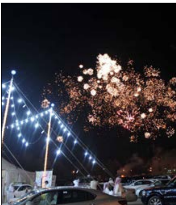
العاب نارية احتفالا بالفوز في مقر مشاري المطوط