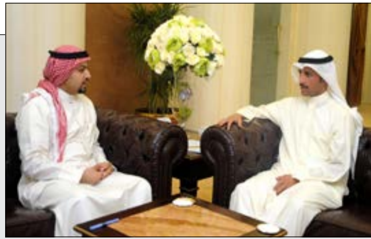
رئيس مجلس الأمة مرزوق الغانم متحدثا إلى ممثل وكالة الأنباء الأردنية (بترا) في الكويت فيصل الشمري

مرزوق الغانم: التعديلات على النظم الانتخابية أنت مواكبة للدستور 04