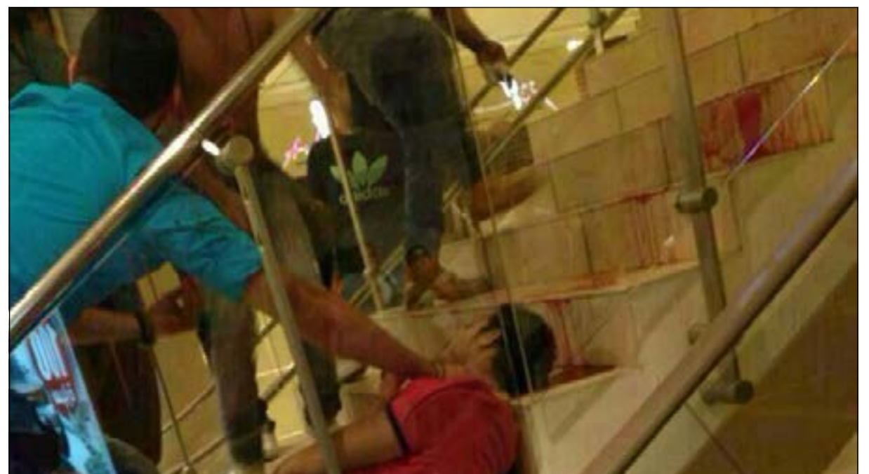
المواطن لفظ أنفاسه الأخيرة جراء نزيف حاد