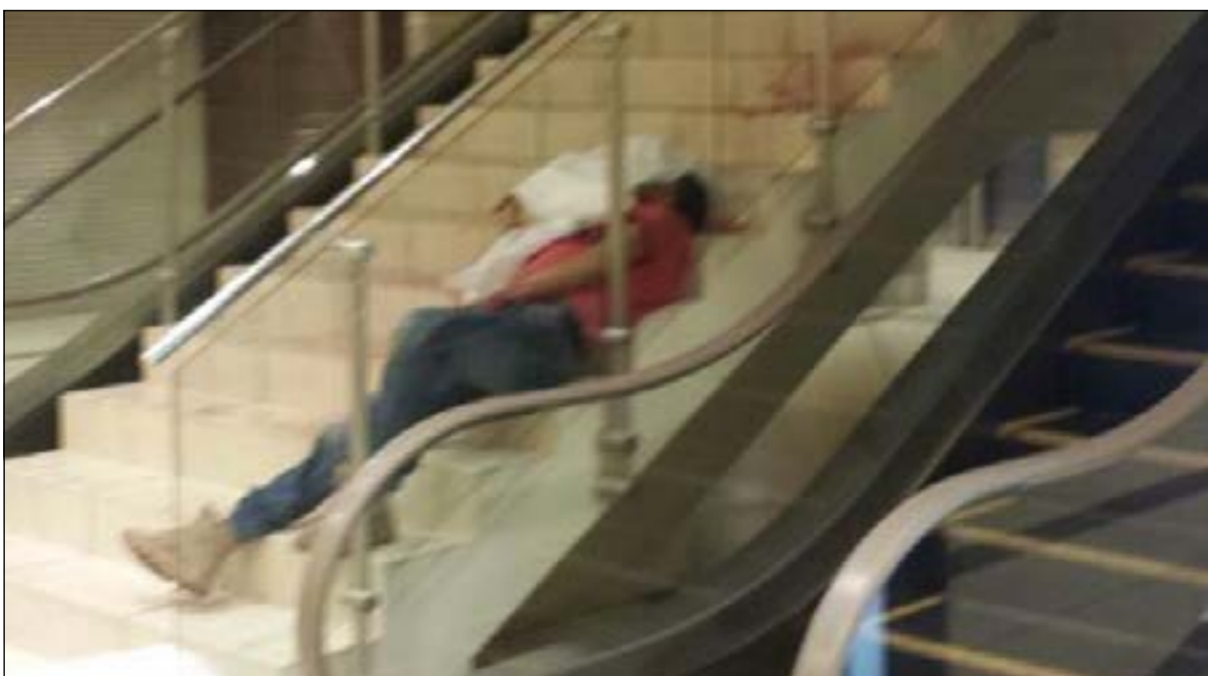
كاميرات المراقبة وثقت الجريمة