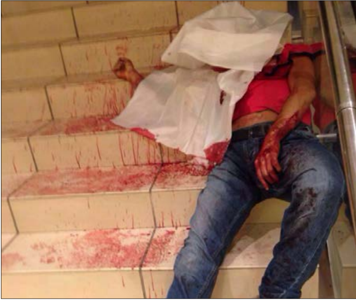
.. ومضرجا في دماثة بعد ان فارق الحياة إثر الاعتداء عليه