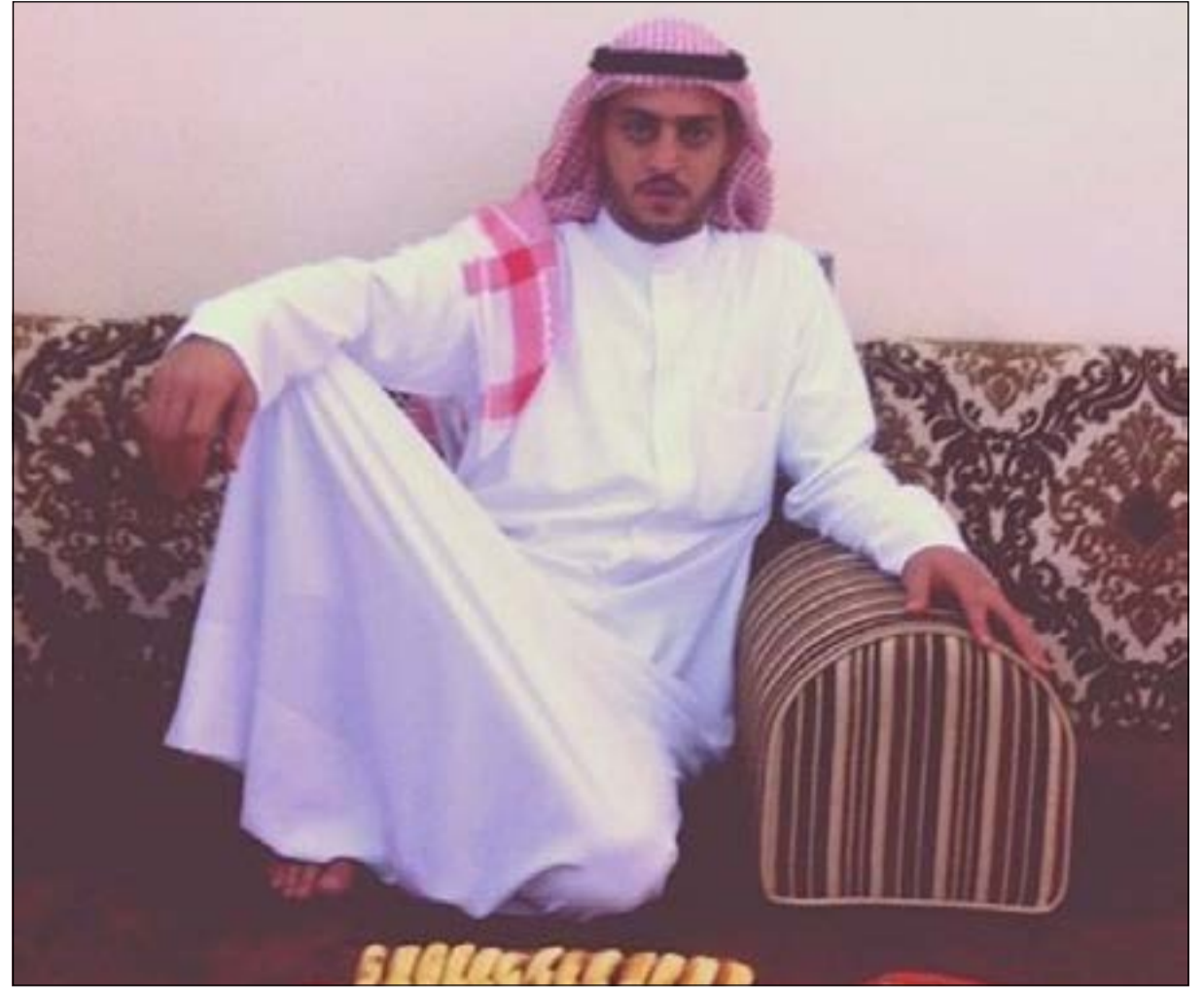
صورة حديثة للمجنني عليه في منزله

بعد أسابيع من صدور حكم بإعدام قتلة طبيب الأفيون