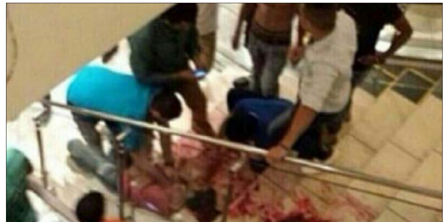
المجنني عليه سقط على سلم المارينا بلا حراك