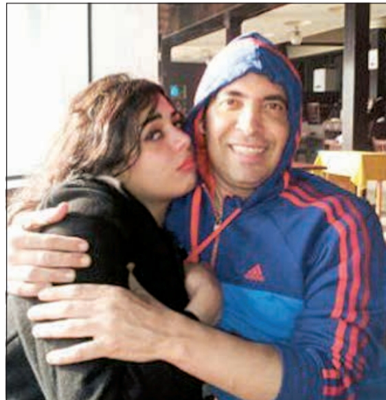
الراقصة شمس وسعد الصغير

رغم مرور سنوات على زواجهما، إلا أن وثيقة تؤكد زواج المطرب سعد الصغير من الراقصة شمس سريت أخيرا، علما أن المطرب الشعبي أنكر في وقت سابق هذا الزواج. وفي الوقت نفسه، تم تسريب مجموعة من الصور التي تجمع سعد الصغير والراقصة شمس في انسجام تام قبل أن تدب الخلافات بينهما وتصل إلى أقسام الشرطة. وتؤكد الوثيقة الزواج قبل 5 سنوات، علما بأن شمس شاركت سعد الصغير في فيلمين وهما «أبقى قلبتي» و«ولاد البلد». ومن المعروف أن سعد الصغير لديه زوجة أولى وأبناء.