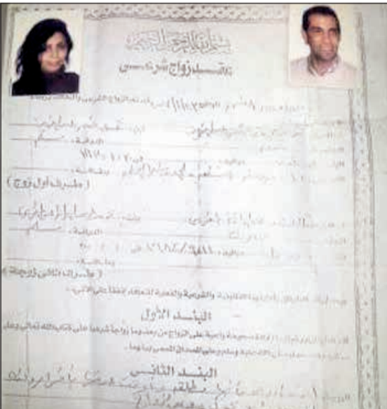
صورة عقد الزواج