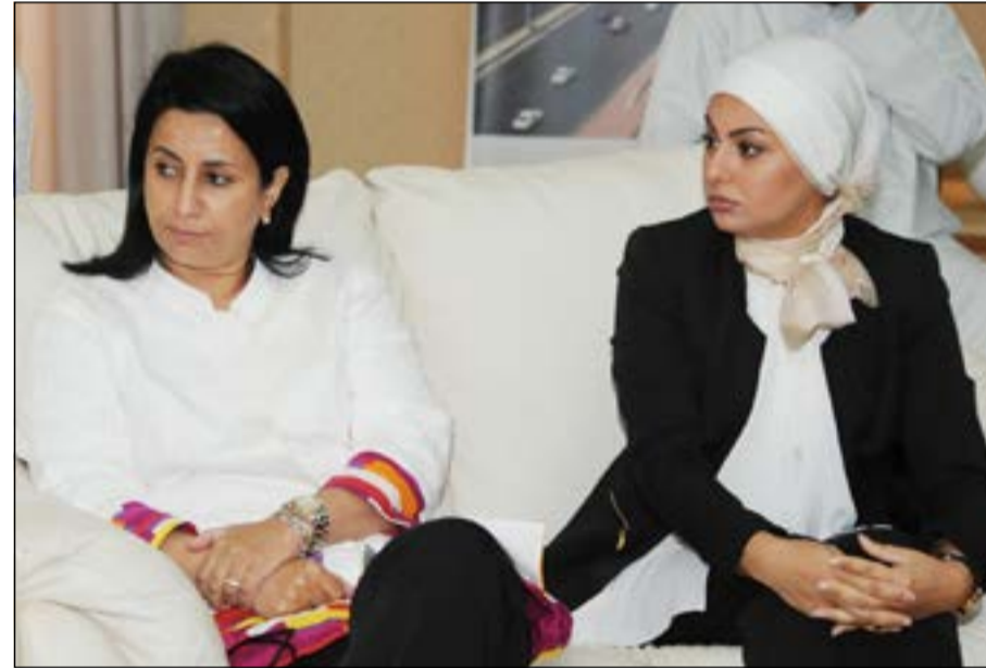
مهندستان قائمتان على مستشفى جابر