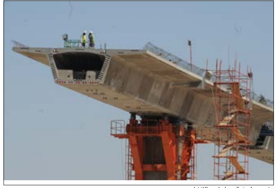
مشروع طريق الجهراء تحت الإنشاء