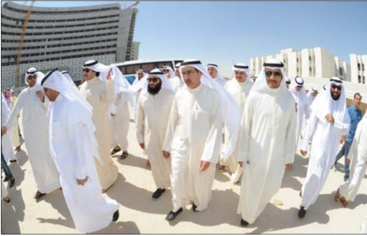
رئيس مجلس الأمة مرزوق الغانم والوفد النيابي يتفقدون موقع مستشفى جابر برفقة وزير الأشغال م. عبدالعزيز الإبراهيم (هاني الشمري)