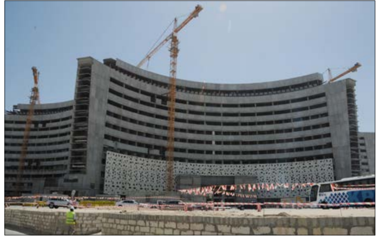
مبنى مستشفى جابر الأحمد

زار والوفد النيابي مستشفى جابر الأحمد وطريقي الجهراء وجمال عبدالناصر