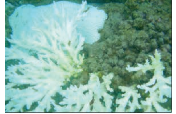
حالة ابيضاض كلي للشعاب المرجانية في جزيرة قاروه سنة 2010