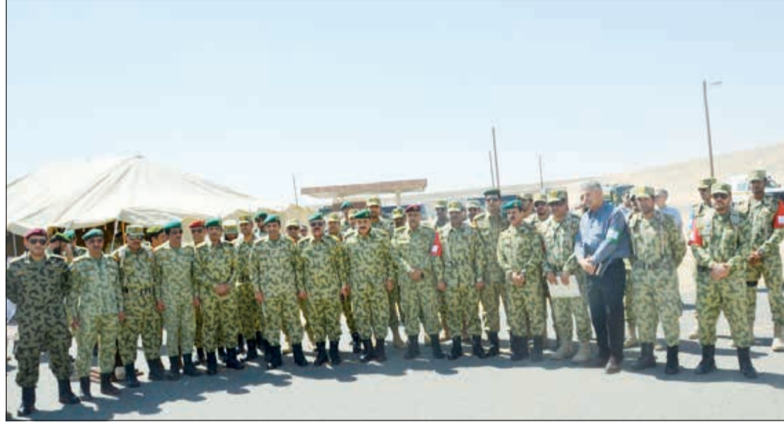
اللواء الركن م.هاشم عبدالرزاق الرفاعي والعميد الركن زيد محمد زيد مع المشاركين في التمرين

تنظم جمعية الصحافيين الكويتية في السادسة والنصف من مساء يوم الأحد 29 سبتمبر 2013 لقاء مفتوحا مع رئيس مجلس إدارة مبرة خير الكويت الشبيخة فريال الدعيح حول عمل المبرة وتجربتها في العمل الخيري والتطوعي والإنساني وشرحا مفصلا عن مشروع إعادة تأهيل وترميم بيوت الأيتام بترع كريم من صاحب السمو الأمير الشيخ صباح الأحمد.