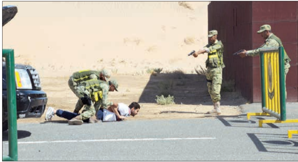
التدريب على قواعد الاشتباك