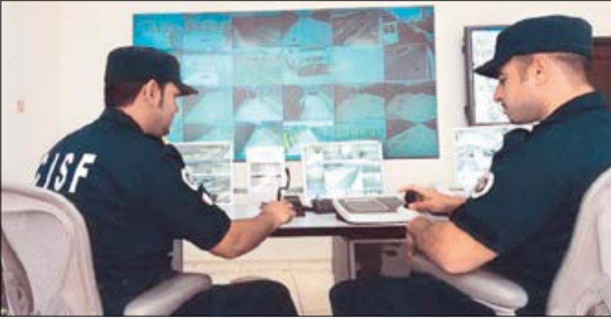
الانتهاء من نقل وتسكين موظفي «خدمات القطاع النفطي» في غضون شهر

والسلامة تم تشكيل لجان من شركة خدمات القطاع النفطي وجميع شركات القطاع النفطي لنقل العاملين وتم الانتهاء من تسكين الموظفين في الشركة الكويتية لنقط الخليج، مشيراً إلى أن جميع موظفي الأمن والإطفاء التابعين لخدمات القطاع النفطي سيظلون مكانهم في الشركات العاملين بها.