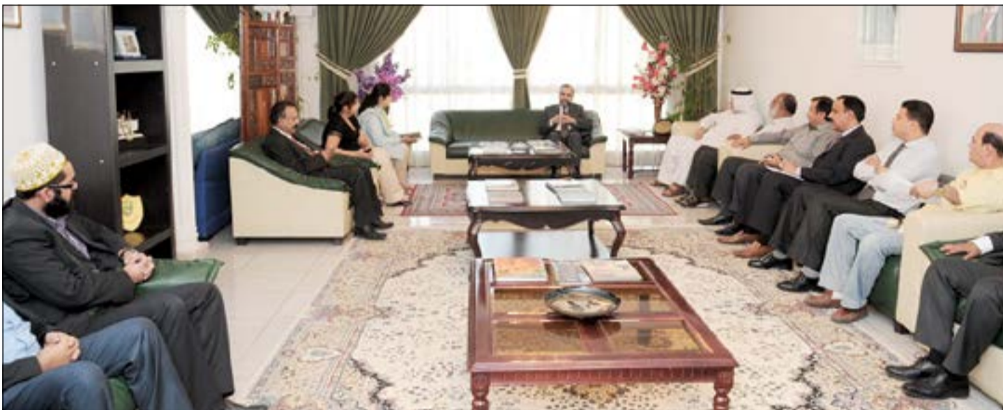
السفير الباكستاني أثناء حديثه مع الوفد الاعلامي والتجاري