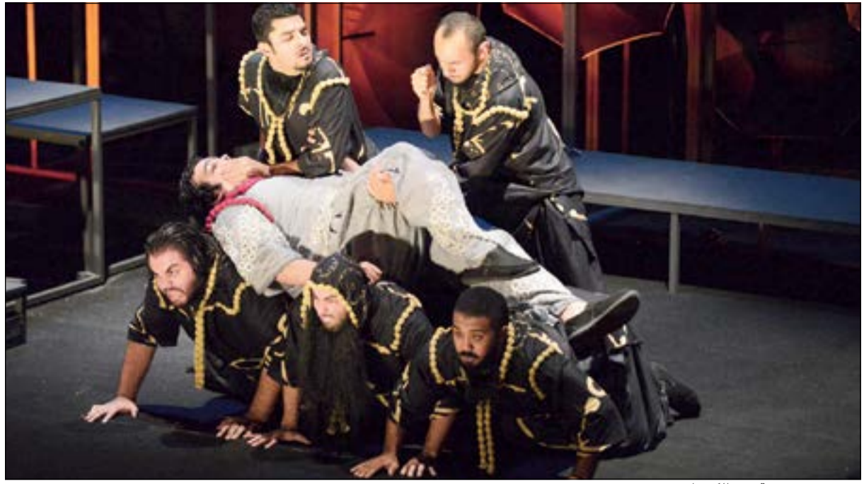
مشهد من مسرحية «حنظلكم واحد»