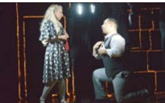
«يوميات أدت إلى الجنون»