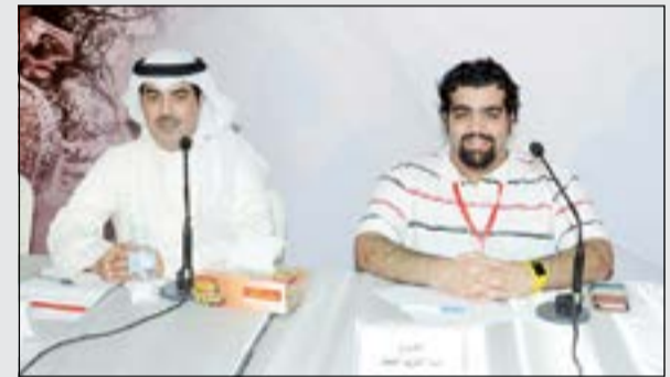
جانب من الندوة النقاشية