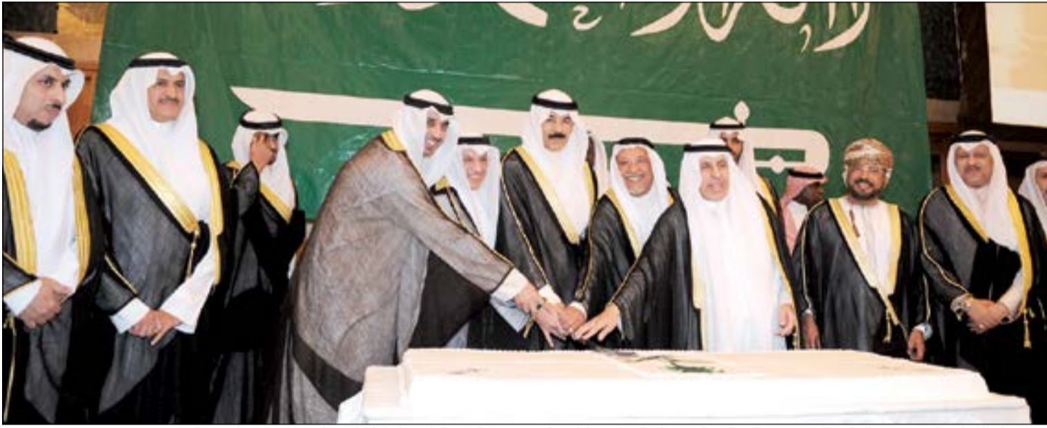
الشيخ خالد الجراح والشيخ محمد الخالد والشيخ محمد العبدالله والشيخ علي الجراح يشاركون السفير د.عبدالعزیز الفایز قطع كيكية الاحتفال بحضور سفراء دول التعاون