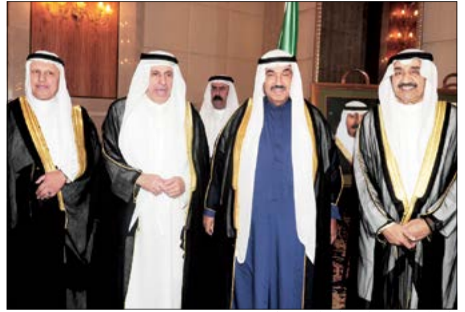
جاسم الخرافي وسمو الشيخ ناصر المحمد يهنتان

الخرافي: متفائل بالمجلس الحالي أكد رئيس مجلس الأمة الأسبق جاسم الخرافي على حرصه على الحضور ليبارك للمملكة عيدها الوطني، داعياً المولى - عز وجل - أن يحفظ المملكة وملكها وحكومتها وشعبها من كل سوء. وقال الخرافي: «حريصون على تهنئة المملكة لما لها من مكانة ومحبة وتقدير واحترام في نفوسنا جميعاً ولا ننسى موقفها المشرف إبان فترة الاحتلال العراقي الغاشم على الكويت». ورداً على سؤال حول توقعاته للمجلس الحالي قال الخرافي «أنا دائماً متفائل ولا بديل عن ذلك، أما فيما يتعلق بالمجلس الحالي وأداء رئيسه مرزوق الغانم لا بد أن نتاح لهم الفرصة لأنهم لم يبداوا بعد».