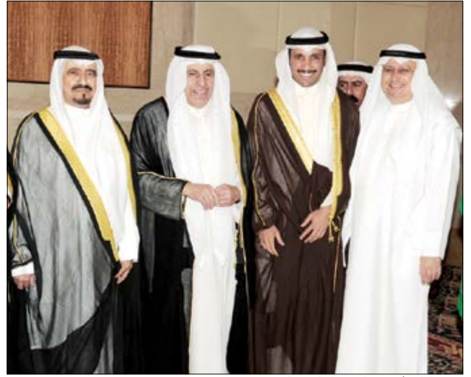
مرزوق الغانم وأحمد بهبهاني يهنتان السفير السعودي

خلال حفل استقبال بمناسبة الذكرى الـ 83 لليوم الوطني للمملكة العربية السعودية