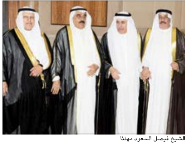
الشيخ فيصل السعود مهنتا

إمباكي: نأمل أن نتمتع بالمملكة بالأمن والاستقرار