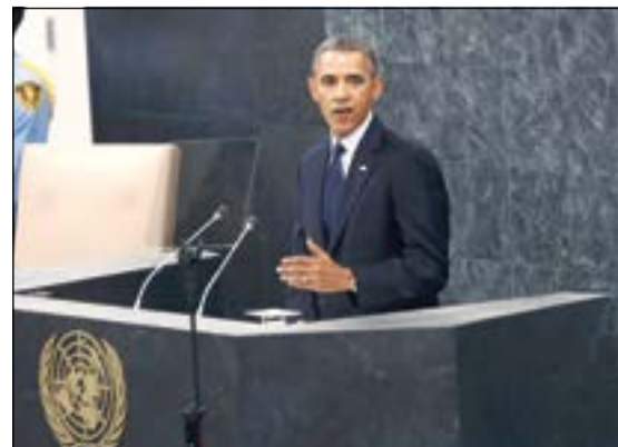
الرئيس الأميركي باراك أوباما يلقي كلمته أمام الجمعية العامة للأمم المتحدة

اندهشت من سرعة التحول في مصر وتونس، وشدد على أن الحكومة التي حلت محل محمد مرسي جاءت استجابة لرغبة الشعب، مضيفاً أن مرسي جاء بالانتخابات لكنه عجز عن حكم مصر. وقال: نطالب الحكومة المصرية باتخاذ إجراءات ديموقراطية وحماية حقوق الإنسان، لكنه شدد على أن الدعم الأميركي لمصر سيكون مرهونا بالتقدم في مجال الديموقراطية.