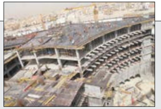
جانب من أعمال مستشفى جابر الأحمد

أسماء الكويتيين المقبولين بالجامعات المصرية على موقع الأنباء: www.alanba.com.kw