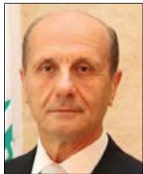
الوزير مروان شربل

الى الضاحية الجنوبية لحماية أهلها بسبب الضغط الأمني على هذه المنطقة بالتحديد املا بنجاح المهمة المزمع تنفيذها. وعن قرار دخول الدولة الى الدولية بحسب البعض اكد انه وزير داخليا لا يقبل ان تكون هناك دولة ضمن دولة، كما انني لا اقبل بان يكون هناك وزير داخليا رديفا في دولة معينة والا اقدم استقالتي وانسحب، وقال: نحن نحاول في ظل الاجواء الامنية الضاغطة والسياسية المعقدة التي نعيشها على الصعيد الداخلي والخارجي ان تثبت الدولة اللبنانية قدر الامكان وجودها في اي منطقة من المناطق اللبنانية، واكد ان القوى الامنية قد اتتت وجودها وبصعوبة، وقدمت شهاد في طرابلس، كما ان الجيش اللبناني وضع ضربة كبيرة في صيدا، داعيا الى عدم التشكيك في وجود الدولة اللبنانية اطلاقا، املا ان تنجح الدولة في خطتها الأمنية في الضاحية الجنوبية.