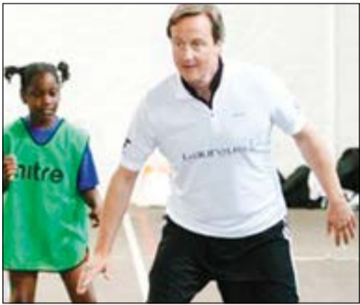
كاميرون أثناء ممارسته كرة القدم

وجهت إدارة وست هام تحذير شديد اللهجة لأعضائه بالابتعاد عن الهتافات العنصرية خلال مباراة فريقها أمام توتنهام على ملعب الأخير في 6 من الشهر المقبل ضمن الدوري الإنجليزي الممتاز.