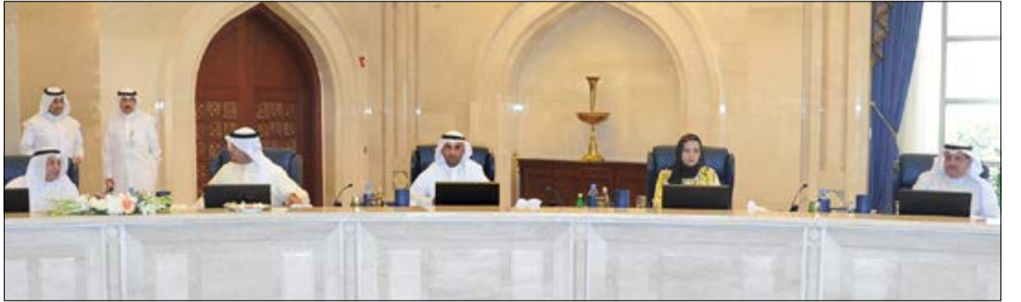
الشيخ خالد الجراح وأنس الصالح ود. نايف الحجرف ونكري الرشيد وعيسى الكندري خلال اجتماع مجلس الوزراء

التحصيل العلمي وتعظيم جدواه بما يسهم في خلق جيل متعلم قادر على تحمل مسؤولياته في بناء الوطن وزيادة رفعة وتقدمه. ثم بحث المجلس شؤون مجلس الأمة وفي هذا الصدد فقد اطلع على نتائج الدراسة التي قام بها مجلس الأمة بشأن أولويات المواطن الكويتي واستعرض نتائج الاستبيان الذي تم إجراؤه على عينة ممثلة للمواطنين بمختلف الشرائح والمناطق والأعمار، حيث تصدرت القضية الإسكانية وتطوير الخدمات الصحية والتعليمية اهتمامات المواطن الكويتي إضافة إلى باقي القضايا المهمة التي عبرت عنها نتائج الاستبيان.