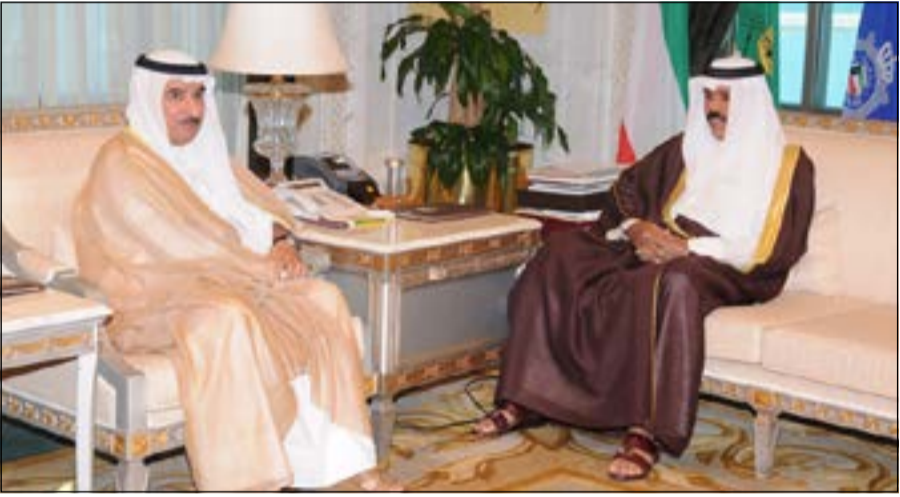
سمو نائب الأمير وولي العهد الشيخ نواف الأحمد مستقبلاً السفير سالم الزمانان