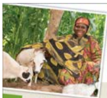
وقف الأضاحي 400 د.ك.

جاء ذلك خلال المؤتمر الصحفي الذي نظمته المبادرة مساء أول من أمس بفندق شيراتون الكويت بمناسبة زيارة المدير التنفيذي لبنك الطعام المصري د.معتز الشهدي، مشيراً إلى أن المبادرة انطلقت مع مطلع شهر رمضان المبارك في يوليو الماضي، بالتعاون مع الهلال الأحمر الكويتي، حيث بلغ إجمالي المبالغ التي قدمتها المبادرة إلى بنك الطعام ما يفوق 3 ملايين جنيه مصري. وأضاف المباركي أن هذه ليست أول مبادرة بل سبق أن قدمنا مساندة للشعب اللبناني بعد أحداث 2006