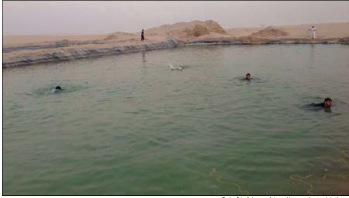
رجال الإطفاء والغواصون خلال عملية تمشيط البركة الملوثة