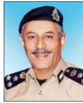
العميد زهير النصرالله

5 أطفال في بركة ماء شمال منطقة الوفرة قرب الكيلو 18، وقال مصدر أمني إن فرق الإنقاذ التابعة للإطفاء توجهت فور تلقي البلاغ إلى الموقع، وتبين وجود خمسة أطفال، وشرع رجال الإطفاء بالدخول سباحة إلى البركة باستخدام الحبال والغواصين وتمكنوا من انتشال الأطفال الخمسة، إلا أن اثنين منهما كانا قد فارقا الحياة وثالث كان بحالة إعياء وغيبوبة وأما الطفلان الآخران فقط أخرجوا بعانين من ضيق في التنفس وتم نقل الثلاثة إلى مستشفى العبدان حيث وضع الطفل الذي كان في غيبوبة بغرفة العناية المركزة، وأما الطفلان الآخران فقط أودعا المستشفى لمزيد من الفحوصات، وتركت جثتا