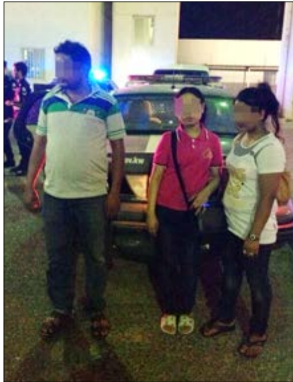
أسبوي وبصحبته امرأتان ضبطوا خلال الحملة

المضبوطين إلى الحجز تمهيداً لإبعادهم عن البلاد. وقال مصدر أمني أن تعليمات من اللواء الطراح للعقيدين صلاح الدعاس وفالج عوض بشأن حملة على منطقة العمار الاستثمارية وعليه تم ضبط العدد المذكور بالإضافة إلى ضبط 4 وافدين كانت بحوزتهم مواد مخدرة