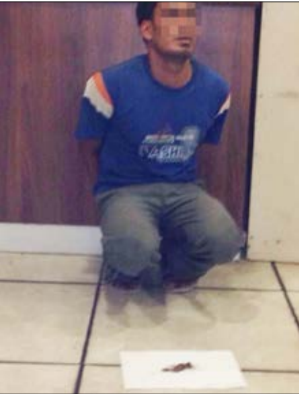
أسبوي ضبط وبحوزته قطع حشيش

وأربعة أشخاص مسجل بحقهم قضايا تغيب وانتهاء إقامة، وأفاد المصدر بأن رجال الأمن سيقومون بملاحقة المخالفين بشكل شبه يومي للتخفيف من أعداد الوافدين المخالفين لقانون الإقامة والمتجربين في المنوعات.