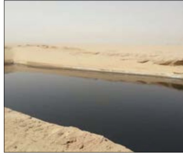
صورة توضح طول البركة الملوثة