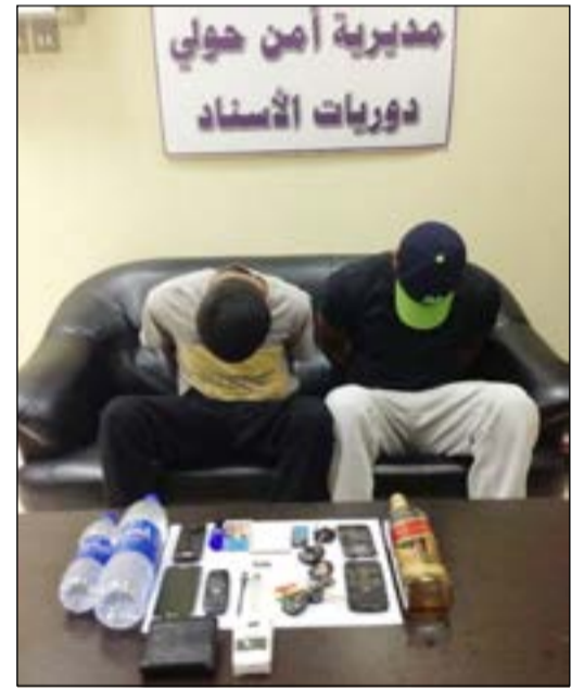
الشابان وأمامهما كمية المخدرات المضبوطة

تمكن رجال أمن حولي من السيطرة على شابين قاما بالتهجم على رجال دوريات إسناد حولي بعد توقيفهما في شارع سالم المبارك بمنطقة السلامة واكتشاف كمية من المواد المخدرة بحوزتهما، وعليه تمت إحالة المتهمين وهما مواطنان كانا بحالة غير طبيعية، وقال مصدر أمني أن دورية تابعة لإسناد حولي كان قائدها في جولة اعتيادية في طريق سالم المبارك بمنطقة السلامة فجر أمس واشتبته بمرحلة أميركية وعند الطلب من قائدها التوقف ترجل من المركبة شخصان أحدهما لا يحمل إثباتاً وسقطت من أحدهما قطعة من المواد المخدرة فطلب منه رجال الأمن الصعود إلى الدوري إلا أنه رفض، وحاولا التهجم على العسكريين اللذين قاما بطلب الإسناد، وبالفعل اجتمع رجال الأمن على الشابين، حيث كانا بحالة غير طبيعية فتمت السيطرة عليهما واتضح أن داخل المركبة عدد من زجاجات الخمر المحلية والمستوردة، بالإضافة إلى قطع حشيش وأدوات تعاط، لتتم إحالة المتهمين مع النقاد التي عثر عليها إلى الإدارة العامة لمكافحة المخدرات.