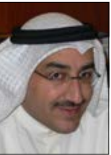
الحامي علي الواووان

قضت الدائرة المدنية بالمحكمة الكلية برئاسة وكيل المحكمة المستشار عادل النجار ببراءة ذمة مواطنة من إقرار دين بمبلغ 200 ألف دينار لصالح رجل أعمال بعد أن اتفق معها على الزواج وتحملها مصاريف إنجاب طفل أنابيب.