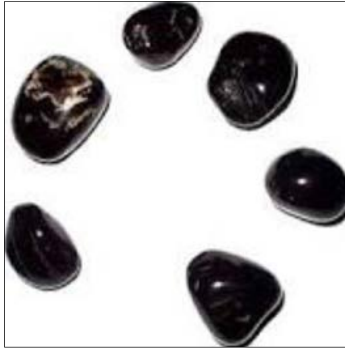
مجموعة من «أحجار الحظ» المضيطة بحوزة الساحر «سبي الحظ»

تكررت ادارة الاعلام الامني في وزارة الداخلية ان حريقا محدودا للغاية نشب مساء امس في مبنى الإدارة العامة للتحقيقات الكائن بمنطقة السالمية وذلك نتيجة تماس كهربائي اصاب وحدة التكييف بمبنى الإدارة، واضافت انه لم يسفر عن الحريق اي