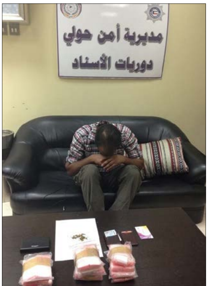
السيلاي «الهاب» وأمامه كمية المخدرات المضيطة

ضمن استراتيجية وزارة الداخلية وجهودها المستمرة لحفظ الأمن وتأكيد الأمان بكافة المناطق وفي إطار الإجراءات والمهام الأمنية المكثفة بالتعاون مع أجهزة الوزارة ذات الصلة، قامت إدارة مرور محافظة حولي التابعة للإدارة العامة للمرور بحملة مرورية في مواقع مختلفة في نطاق عمل محافظة حولي.