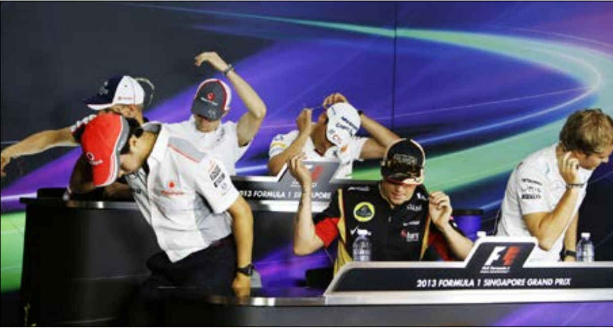
اللاتي سيباستيان فيتل البطل الاول للفورمولا واحد