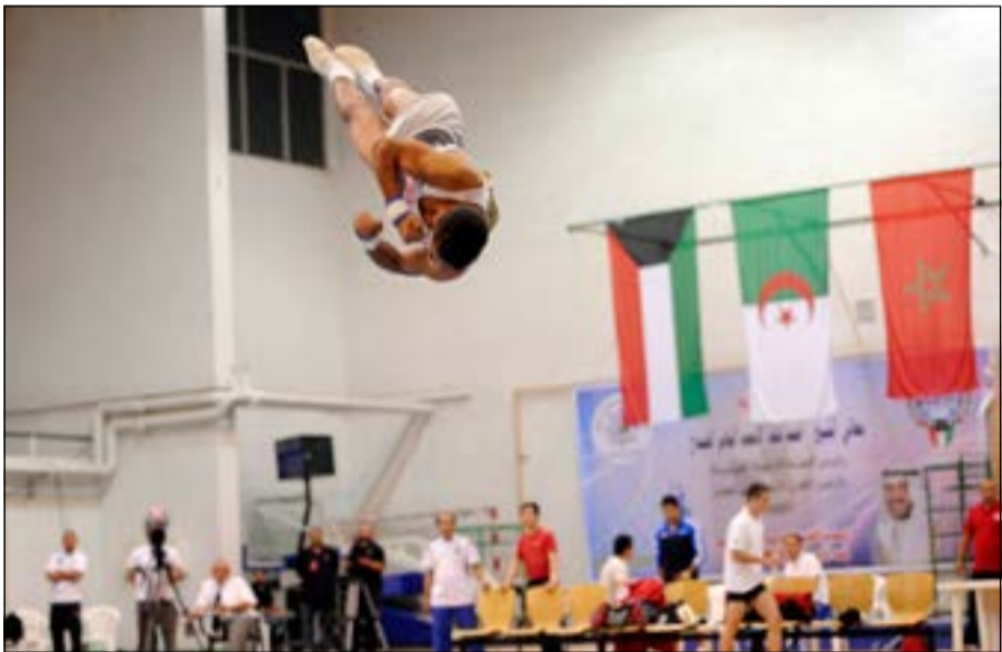
فكرة مميزة حازت العلامة الكاملة