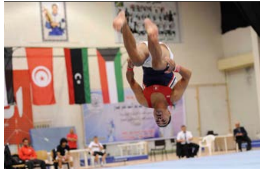
مهارة ولياقة في العروض

الحركة الرياضية بالإكثار من المشاركات في البطولات المحلية والخارجية لكسب الخبرة والاحتكاك. ونكر أن مشاركة لاعبي الكويت لاسيما صغار السن في هذه البطولات القوية واحتكاكهم مع الأبطال العرب تساهم في تطوير مستوياتهم الفنية واكتسابهم خبرات مهمة، منمنا دور الاتحاد الكويتي للعبة في استضافة مثل هذه المناسبات الكبرى.