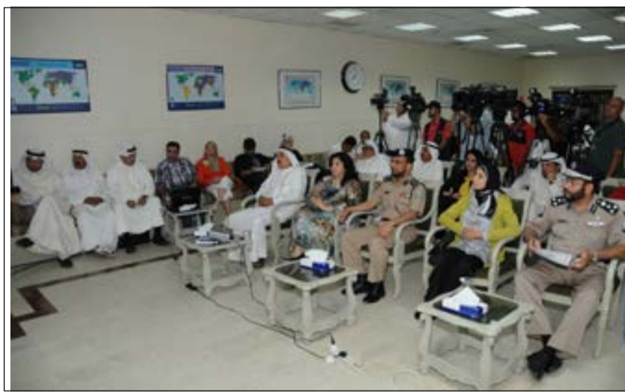
متابعة من الحضور للندوة

الوعي المروري من خلال مختلف الوسائل، وإرسال المعلومات إلى الجميع سواء كانوا مؤسسات، أو هيئات، أو مدارس وجامعات، ونسعى من خلال استخدام وسائل التواصل وشبكة الإنترنت إلى إيصال المعلومة التي نجد فيها صعوبة، وإيصال النصح المرورية. وأضاف: استطعنا من خلال إنشاء موقع للإدارة على الإنترنت إلى تلقي شكاوى الناس بطريقة أسهل من التي كانت تستخدم، والآن من خلال موقع الإدارة العامة