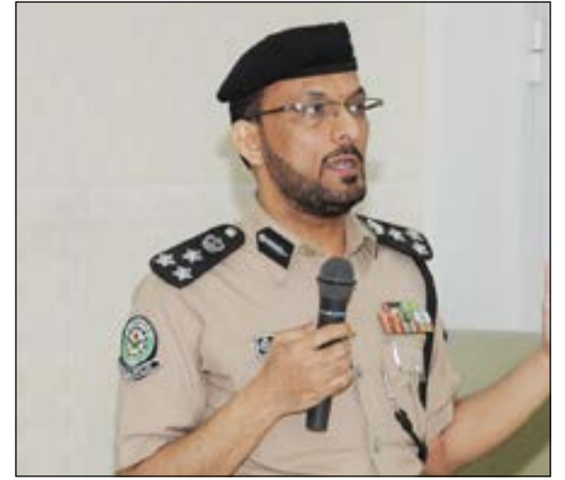
العقيد ناصر العنزي عرض مشاريع الإدارة العامة للمرور لمعالجة المشاكل المرورية

وكيل «المرور» اللواء عبدالفتاح العلي خلال ندوة «الأزمة المرورية في الكويت.. المشكلة والحل» في جمعية الصحفيين: