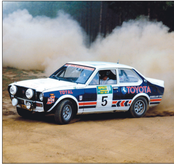
لقطة لطراز من سيارة تويوتا كورولا