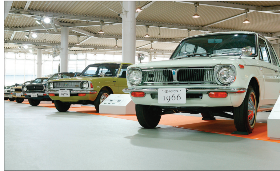
أحد طرازات تويوتا كورولا

أعلنت تويوتا أخيراً عن تخطي المبيعات التراكمية لمركبتها تويوتا كورولا، أكثر المركبات شعبية في العالم، حاجز الأربعين مليون مركبة في شهر يوليو، محققة مبيعات بلغت 40.01 مليون مركبة، ويمثل هذا الرقم القياسي العالمي، إنجازاً تاريخياً آخر لكورولا، مركبة تويوتا الأسطورية التي تربعت على عرش المركبات الأكثر مبيعا في العالم، وبالإشارة إلى النجاح الذي حققته تويوتا كورولا، قال شينيتشي ياسوي، كبير مهندسي كورولا الحاليين: «أشعر بان هذه المركبة قد وصلت إلى مكانتها الريادية بسبب تقدير الناس لها في جميع أنحاء العالم، وأنتي فخور جدا بإسهامي في إنشائها وأشعر بالكثير من الامتنان لجميع الذين امتلكوا وأحبوا مركبة كورولا. هذا ويرجع السر وراء نجاح كورولا إلى الشغف والإخلاص لمفهوم تطويرها المتوارث عن الفلسفة التي وضعها هاسيغاوا، كبير مهندسي الجيل الأول من كورولا: إن مركبة كورولا يجب أن تجلب السعادة والرفاه للناس في جميع أنحاء العالم».