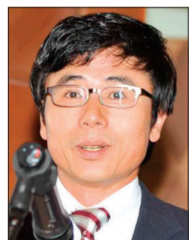
دي واي كيم

ويوظف جهاز العرض الذي يتمتع بميزة الإسقاط عن قرب Ultra Short Throw. UST تقدمنا من الناحية التقنية لنظام الإضاءة الذي يعتمد على تقنية ليزرية. ويمتاز الجهاز بمصباح يعمل لمدة 25 ألف ساعة بدون الحاجة لتبديله، وهذا يجعل عمره أطول بخمس مرات من عمر مصباح الزئبق غير المنسجم مع البيئة. إن اهتمام ال جي بعدم استخدام المواد التي تدخل فيها مادة الزئبق من منتجاتها ذات الجودة العالية يعد دليلا على سعي الشركة لتصبح أكثر رفقا بالبيئة. ويعد جهاز الإسقاط الليزري من ال جي الباطين خطوة كبيرة لبدء عصر جديد من أجهزة تلفاز الترفيه المنزلي للمستهلكين في الكويت، حيث ستصبح الانعكاسات الضوئية وشاشات العرض الصغيرة