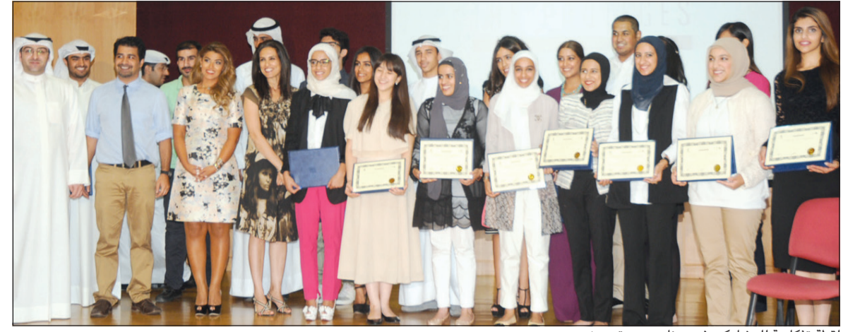
لقطة تذكارية للمشاركين في برنامج «بروتوجيز»

طرح مركز النصر الرياضي أقوى الحملات الترويجية من نوعها وأفضل العروض المتنوعة بمناسبة العودة إلى المدارس، لتوفر تشكيلة ضخمة ومتنوعة وشاملة في جميع معارضها لتساعدهم على شراء جميع مستلزماتهم الدراسية من مكان واحد وبأسعار تناسب جميع الميزانيات وجودة متميزة تروق لمرتادي مركز النصر الرياضي. والجدير بالذكر ان التشكيلة المدرسية الآن متوفرة في جميع معارض مركز النصر الرياضي المنتشرة في جميع أنحاء الكويت، ولتختصر الطريق على عملائها وتسهل لهم عناء الطريق، كما توفر في معارضها الكبرى كالري والعقيلة والعدسان والبرج الأخضر وجمعية حولي والناصر مول بالجهراء ومجمع الأنفال السالمية الأدوات القراسية والمكتبية واكسسوارات الدراسة التي لا بد من اقتنائها لأبناء. والجدير بالذكر ان الحقبة المدرسية التي