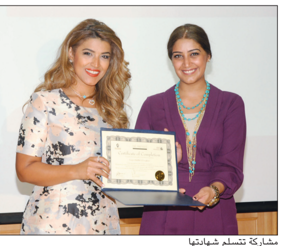
مشاركة تتسلم شهادتها