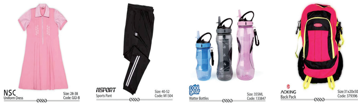
NCS Uniform Dress Size: 28-38 Code: GG48 NEPORT Sports Pant Size: 40-52 Code: M1304 Water Bottles Size: 355ML Code: 123847 ACKING Back Pack Size: 31x20x50 Code: 373996