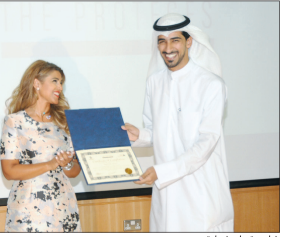
شاب يتسلم شهادته

كما عودتنا الماركة Saint Honore على كل تميز وإبداع بدأ التطلع للثقافة العربية وإضافة لمسة من التألق العربي للعلامة التجارية مع توقيع صبا مبارك، النجمة الأردنية للتلفزيون والسينما، وأصبحت سفيرة العلامة التجارية الخاصة بهم. تشتهر صبا مبارك بأسلوبها العاطفي الحنون الذي يصل لجمهورها عبر الشاشات - سواء الصغيرة أو الكبيرة - في العالم العربي وحصلت عالمة على معدل مبيعات عالية كما منحت مؤخرا لقب «أفضل ممثلة عربية» في مهرجان السينما في الأردن. وكان الموقع تأييد صبا مبارك من مجموعة Saint Honore للساعات الفاخرة والإكسسوارات والمجوهرات وتصيغ الوجه الاعلاني لتسويق العلامة التجارية بين عشاق الساعات والمجوهرات