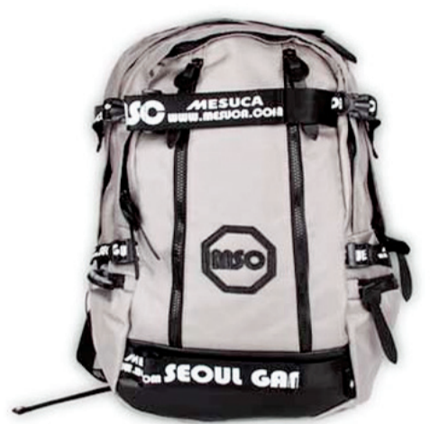
MESUCA Jack Pack Size: 31x15x45 Code: 367604

ملبئة بالمفاجآت لهذا العام الدراسي فتمتيز الحقائق بالونها المميزة للبنات بالوان الوردى والبفسجي والفوشي والابيض الزهري، وتاتي بالوان مفعمة بالحوية للاولاد كالأصفر والأخضر والبرتقالي، وتاتي من ماركة Disney التشكيلة القراسية من الدفاتر والأقلام والكشاكيل وحافظات الأقلام، ومن المسؤولية الاجتماعية التي اصبحت على مركز النصر الرياضي والتي اعتاد عليها جميع طلاب المدارس بالكويت طيلة السنوات الماضية الملابس الرياضية الملونة بالأصفر والأحمر والأخضر والابيض والشورت الأسود الذي لا بد من ارتدائه أثناء حصص الرياضة المدرسية. وتقدم تشكيلة العودة إلى المدارس أيضا الاحذية المرحة والطبية والخفيفة المفتوحة خلال النهار، للحصول على إطلالة كلاسيكية رائعة عند ارتدائها ولنمنح أبناءنا الراحة طوال فترة اليوم