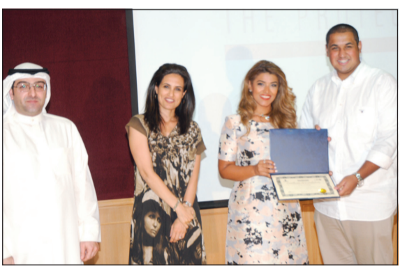
تكريم أحد المشاركين

الكاتب الإنجليزي الشهير وليم شكسبير. هناك، نظم فريق المرشدين ورشات عمل للمشاركة، كما استمتع الجميع بأنشطة مختلفة منها ركوب الدراجات الهوائية للنزهة عبر أراضي الريف الإنجليزي الأخضر الساحر، والإشتراك بمسابقة للطهي، وإداء مشهد جنائي مشوق بإشراف مجموعة من الخبراء القضائيين المختصين، كما استمتع الجميع أيضا بجولة سياحية في مزرعة ستراتفورد للفراشات/ Stratford Butterfly Farm وشركة شكسبير الملكية/ The Royal Shakespeare Company، وكانت تجربة فريدة من نوعها لزيارة مصنع سيارات لاندروفر تحديات الغد».