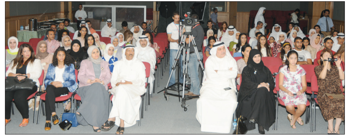
متابعة من الحضور

الكاتب الإنجليزي الشهير وليم شكسبير. هناك، نظم فريق المرشدين ورشات عمل للمشاركة، كما استمتع الجميع بأنشطة مختلفة منها ركوب الدراجات الهوائية للنزهة عبر أراضي الريف الإنجليزي الأخضر الساحر، والإشتراك بمسابقة للطهي، وإداء مشهد جنائي مشوق بإشراف مجموعة من الخبراء القضائيين المختصين، كما استمتع الجميع أيضا بجولة سياحية في مزرعة ستراتفورد للفراشات/ Stratford Butterfly Farm وشركة شكسبير الملكية/ The Royal Shakespeare Company، وكانت تجربة فريدة من نوعها لزيارة مصنع سيارات لاندروفر تحديات الغد».