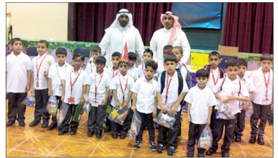
جانب من توزيع الوجبات على الأطفال

قامت جمعية الصليبية التعاونية كعادتها بتوزيع الوجبات الغذائية مع بداية العام الدراسي للطلبة المستجدين في رياض الأطفال والمرحلة الابتدائية في مدارس منطقة الصليبية، وذلك انطلاقا من دور الجمعية المجتمعية، وتشجيعا من مجلس الإدارة للتلاميذ على الإقبال على الدراسة في خطوة لاقت إعجاب الإدارات المدرسية وأولياء الأمور.