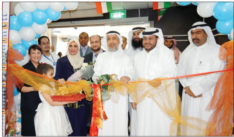
قص شريط الافتتاح

أعلنت إيكيا، سلسلة المفروشات السويدية العالمية الشهيرة، إطلاق منشورها السنوي الموقع في الكويت «كتالوج إيكيا 2014». لقد بدأ توزيع «كتالوج إيكيا 2014»، من الباب إلى الباب، في 1 سبتمبر من هذا العام، وسيغطي أكثر من 500,000 منزل، في أنحاء الكويت كلها. إن الكتالوج الجديد يتكون من 324 صفحة تضم منتجات إيكيا، وتقدم نصائح وإلهاما للعيش مع الأطفال. وسيتم توزيع كتالوج إيكيا الجديد في 43 بلدا مع 62 إصدارا تدعمها ميزات جديدة لاكتشاف الكتالوج. وبعد دخوله السنة الثانية من إعادة إطلاقه، يؤدي كتالوج إيكيا الجديد تطبيقا عمليا يساعد الأطفال والبالغين على الإبداع، لخلق المنزل الذي يلائم أفراد العائلة كلهم. استخلاصا لرؤى الحياة اليومية وتمثلا بها، يتابع كتالوج إيكيا 2014 رحلته المنشودة إلى قلوب الناس. إضافة إلى ذلك، واصلت إيكيا تطوير الأفلام والميزات التفاعلية التي تشكل عامل جذب تسويقيا في الحياة،