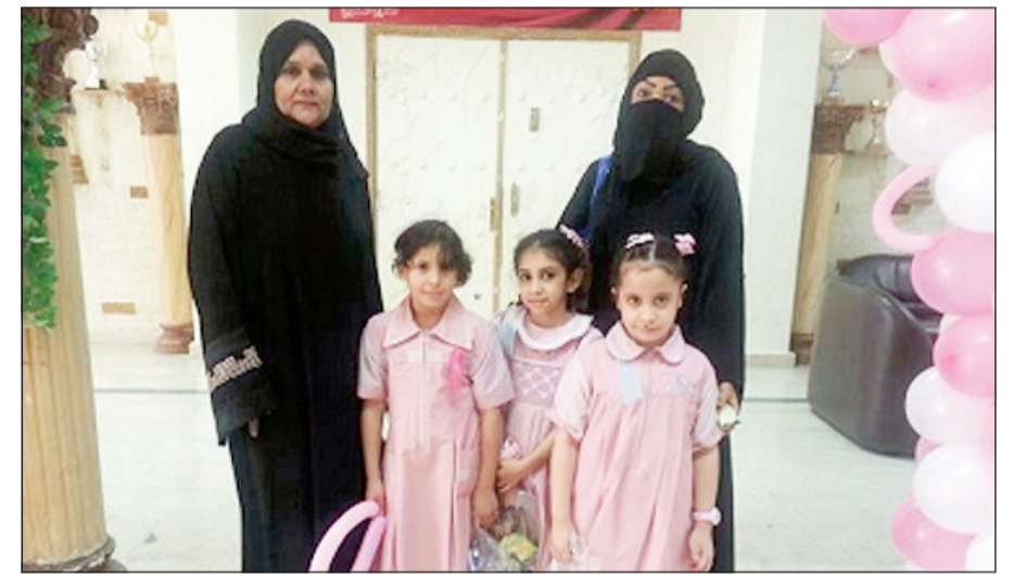
البراعم التحقوا برياض الأطفال