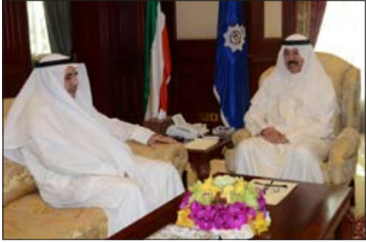
وزير الداخلية الشيخ محمد الخالد مستقبلاً خالد العودة

استقبل نائب رئيس مجلس الوزراء ووزير الداخلية الشيخ محمد الخالد، في مكتبه بمقر وزارة الداخلية امس رئيس لجنة أهالي المرتهين الكويتيين في غوانتانامو خالد العودة حيث أطلع معاليه على آخر المستجدات الخاصة بعمل اللجنة ودورها في هذا الإطار.