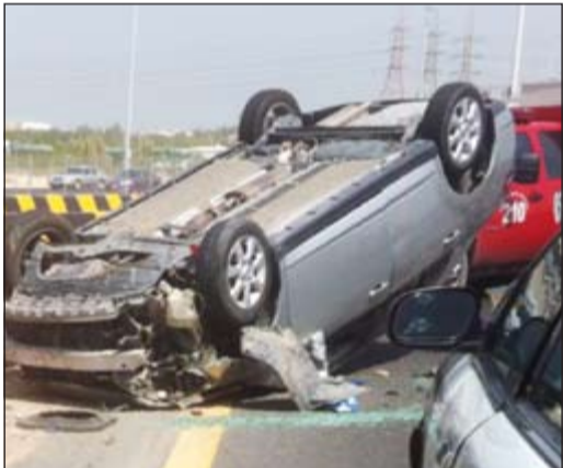
انقلاب ورسلة الدوحة الذي أصيب فيه المواطن

لقي مواطن مصرعه اثر اصطدامه بإحدى الأشجار الواقعة على طريق السالمي السريع ظهر امس وتم نقل الجثة عن طريق رجال الادلة الجنائية وتم تسجيل قضية بالواقعة. وقال مصدر امني إن بلاغا ورد إلى غرفة عمليات وزارة الداخلية عن حادث اصطدام مركبة بإحدى أشجار طريق السالمي وتحديدًا عند الكيلو 31 وعليه توجه ضابط الارتباط ماجد الصلبي ورجال الإسعاف وتبين ان المصاب لفظ أنفاسه الأخيرة متأثرًا بالإصابة التي لحقت به. ومن جانب آخر أدى انقلاب مركبة يابانية ظهر امس في الدوحة التي إصابتها بإصابات متفرقة نقل على أثرها إلى المستشفى وقام رجال الإطفاء بسحب المركبة وتوقيف الطريق بالتعاون مع دوريات النجدة حتى قام رجال الإسعاف بحمل المصاب والانطلاق به للمستشفى لتلقي العلاج.