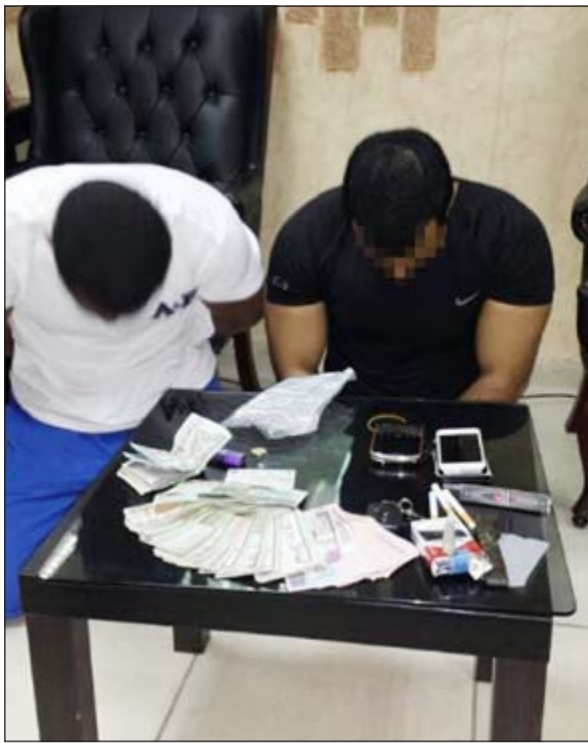
الشابان وامامهما قطع الحشيش المضبوطة