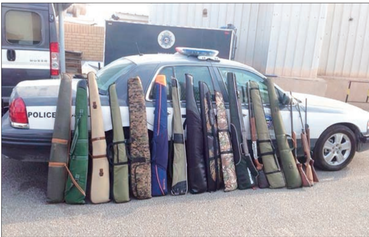
مجموعة بنادق «الشوزن» المضبوطة خلال حملة أمن الجهراء بالسالمي

لضبط «القناصة». وأفاد المصدر بان حملة للجهراء انطلقت فجر امس وتم خلالها ضبط الكمية المذكورة من الأسلحة بالإضافة إلى ضبط شخصين بحالة تعاط، وأخربن بحالة سكر وتحرير 56 مخالفة مرورية.