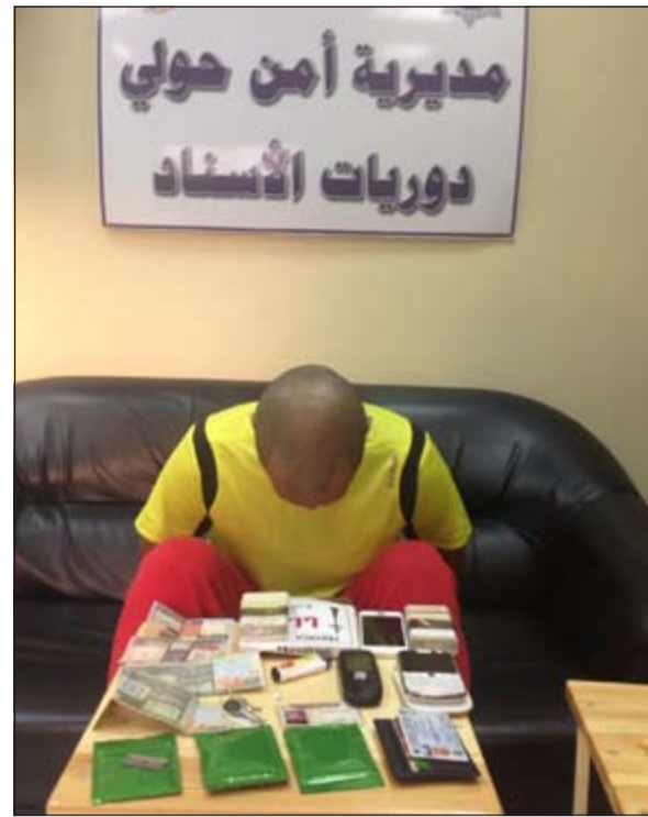
المضبوطات أمام المتهم