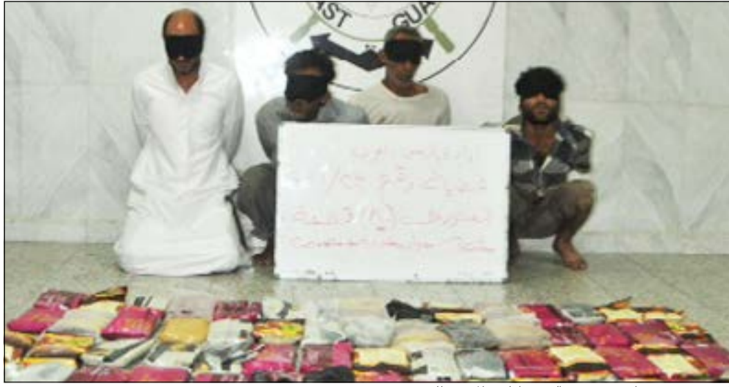
المرجون بعد ضبطهم في عرض البحر وامامهم المضبوطات