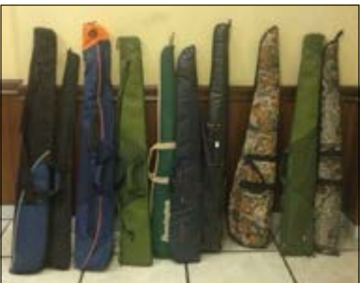
بناتق الصيد المضبوطة

تقدم وافر أوروبي الي مخفر في محافظة حولي وقال لرجال الامن ان ابنه من مواليد 1999 اختطف من قبل شخصين زعما بانهم من رجال امن الدولة وان الجناة هددوا ابنه بانهم سيورطونه في قضية مخدرات، وأضاف اخطف ابني وجرى اضطرابه من قبل المدعي عليهما عليه وصوروه وابتزروه ثم اطلقوا سراحه واعادوه الي مسكنه، وسجلت قضية خطف وابتزاز وأحيلت إلى النيابة.