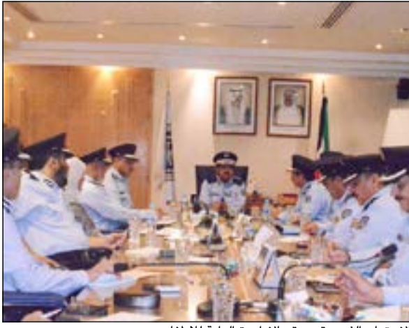
الاجتماع الذي عقد بمقر الإدارة العامة للإطفاء