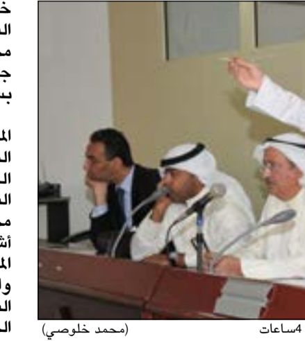
«التجارة» تحاول السيطرة على العمومية التي عقدت على مدار 4ساعات (محمد خلوصي)

خطئه، ومع ذلك إذا كان الفعل المنسوب إلى أعضاء مجلس الإدارة يكون جريمة جزائية فلا تسقط الدعوى إلا بسقوط الدعوى الجزائية». كما خالفت الشركة نص المادة 237 من قانون الشركات التي تنص على أن «تتعقد الجمعية العامة العادية السنوية بناء على دعوة من مجلس الإدارة خلال الثلاثة أشهر التالية لانتهاء السنة المالية، وذلك في الزمان والمكان اللذين يعينهما عقد الشركة، وللمجلس أن يدعو الجمعية للاجتماع كلما دعت الضرورة إلى ذلك، وعلى مجلس الإدارة أن يوجه دعوة الجمعية للاجتماع بناء على طلب مسبق من عدد من المساهمين يملكون 10٪ من رأسمال الشركة، أو بناء على طلب مراقب الحسابات، وذلك خلال خمسة عشر يوماً من تاريخ الطلب، وتعد جدول الأعمال الجهة التي تدعو إلى الاجتماع» ويسري على إجراءات دعوة الجمعية ونصاب الحضور والتصويت الأحكام الخاصة بالجمعية التأسيسية».