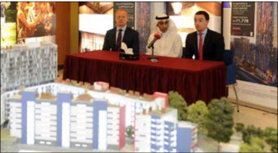
جانب من المؤتمر الصحافي للاعلان عن تفاصيل المشروع

وأشار إلى أن البرج يقع في منطقة «كرويدون» التي تشهد حالياً تنفيذ مشاريع جديدة من قبل حكومة لندن، من بينها مشروع على بعد 120 فقط من موقع البرج وهو عبارة عن مجمع تجاري حديث تحت الإنشاء تابع لشركة «ويست فيلدرز» يقع على مساحة 100 ألف متر مربع، كما أن المشروع يقع بالقرب من محطة القطارات التي تربط المنطقة بشبكة قطارات تربطها مع وسط لندن خلال 13 دقيقة فقط. وأكد القطامي أن الشركة طرحت أسعاراً تنافسية من خلال هذا المشروع، حيث قال إن أسعار البيع تبدأ من 500 جنيه اللقدم المربعة مقارنة بـ 2000 جنيهه للقدم للوحدات السكنية الواقعة في وسط لندن، مما يجعل من هذا البرج فرصة استثمارية مواتية جداً للراغبين في التملك أو الاستثمار العقاري في لندن في الوقت الحالي. وأشار إلى أن الشركة وفرت نظاماً فريداً وسلساً للدفعات تبدأ بدفع 10٪ من قيمة الوحدة السكنية عند التعاقد، ثم 10٪ أخرى بعد عام من التعاقد، على أن يتم سداد النسبة المتبقية والبالغة 80٪ عند تسلم الوحدة في العام 2017.