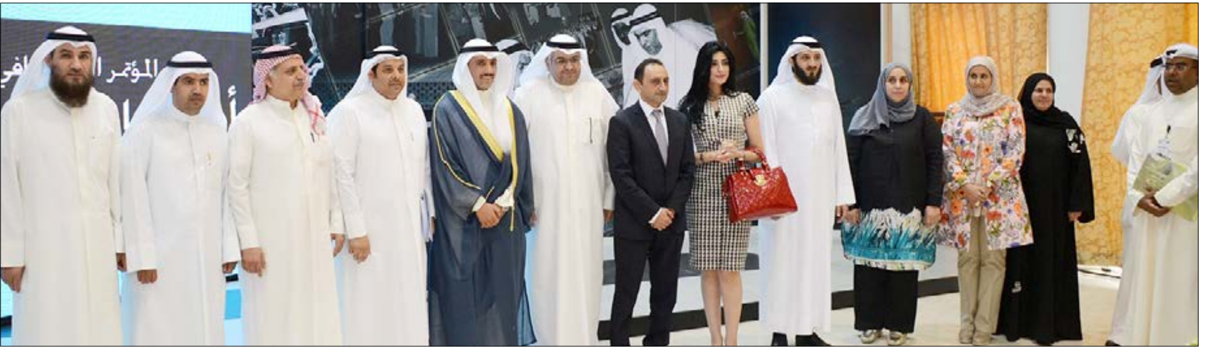
مرزوق الغانم متوسلاً الجهات المنفذة للاستبيان الشعبي لأولويات المواطنين

الصانع: الاستطلاع يشمل الدوائر الانتخابية الخمس وجميع الفئات العمرية