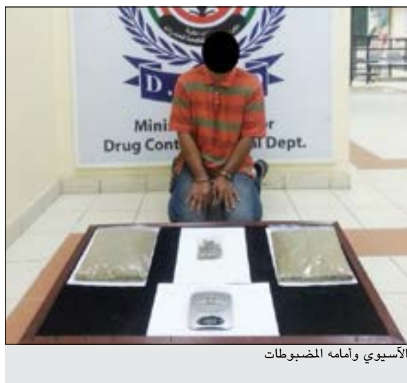
الآسيوي وأمامه المضبوطات