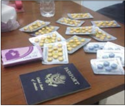
المضبوطات وجواز سفر الوافد

أحيل أميركي الى الجهات المختصة من قبل رجال جمارك منفذ العبدلي بعد ضبطه وبحوزته كميات كبيرة من المنشطات، وعليه تم رفع تقرير بالواقعة. وفي التفاصيل التي يرويها مصدر امني ان رجال جمارك العبدلي أثناء تفتيش سيارة احد المسافرين وهو أميركي تبين ان الحقائق التي كان يحملها بها كمية كبيرة من الحبوب الجنسية التي أحيل بسببها الى جهة الاختصاص.