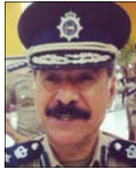
العميد غلوم حبيب

امر مدير امن حولي العميد غلوم حبيب بحالة ثلاثة واقدين من الجنسية المصرية في منطقة الغرقة الى الادارة العامة لمكافحة المخدرات بعد ضبط كمية من المخدرات بحوزتهم. وفي التفاصيل التي يرويها مصدر امني لـ «الأناباء» ان تعليمات من العميد غلوم حبيب جاءت لرجاله بالانتشار على عموم المحافظة لضبط الامن ورصد الأشخاص المشتبه بهم للقضاء على كثرة الجرائم في المنطقة وجاءت تعليمات العميد غلوم بالتطبيق على ارض الواقع حينما اشتبه رجال أمن حولي أثناء جولتهم في منطقة الغرقة يوم امس الاول بثلاثة اشخاص كانوا يقودون مركبة امريكية ويتوقفهم تركوا سياراتهم واطلقوا ارجلهم للريح ليتم السيطرة عليهم وتبين أنهم من الجنسية المصرية واحدهم