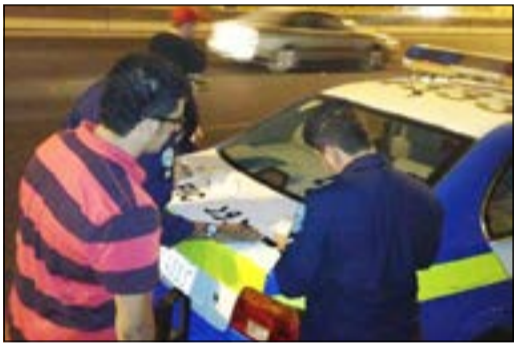
رجال المرور يحررون المخالفات

قامت إدارة المهام الخاصة التابعة لإدارة العامة للمرور بحملة مرورية بمواقع مختلفة في محافظتي العاصمة وحولي بالإضافة إلى عمل ثلاثة مواقع رادار، وأسفرت الحملة عن تحرير 1970 مخالفة مرورية وحجز 10 سيارات لتجاوزها حدود السرعة المقررة. وأكدت الإدارة العامة للمرور استمرار حملاتها لحد من المخالفات الجسيمة والإسهام في المحافظة على أرواح قائدي المركبات من المواطنين والمقيمين بهدف القضاء على جميع الظواهر السلبية.