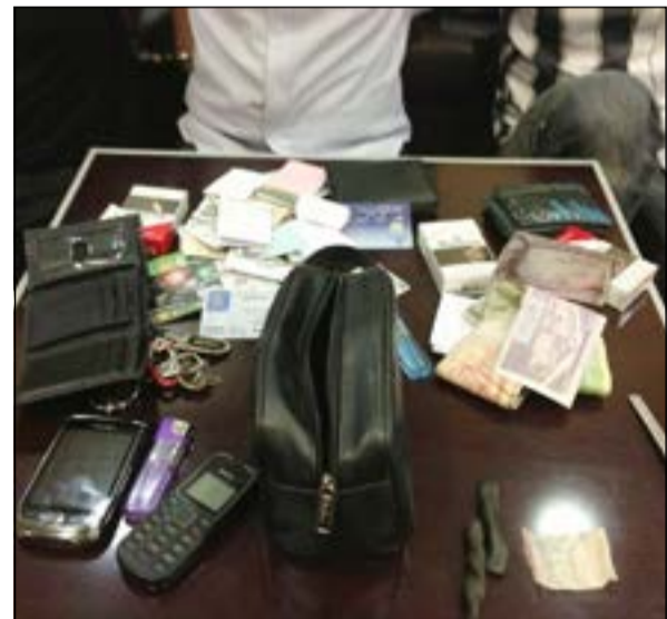
الوافدون الثلاثة أحيوا الى المكافحة مع المضبوطات