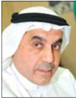
د. عبد الله الطريجي

تقدم النائب د.عبدالله الطريجي باقتراح برغبة طالب فيه بـ«توحيد اعتماد التوقيع الصادر من غرفة التجارة والصناعة للشركة أو المؤسسة ليعتمد لجميع الدوائر الحكومية وتعميم ذلك على مؤسسات وإدارات الدولة ذات العلاقة وكذلك السماح لكل مندوبي الشركات والمؤسسات لإنجاز المعاملات طالما قدموا ما يثبت صحة اعتمادهم للجهة التي يعملون لديها». وتابع: يمثل القطاع الخاص صرحاً اقتصادياً مهماً يتطوّر تحتته الكثير من الشركات والمؤسسات الكويتية التي يجب على مؤسسات الدولة الاهتمام بها وتسهيل الإجراءات الإدارية المتعلقة بها ومن ذلك اعتماد التوقيع حيث نجد هناك اعتماداً لغرفة التجارة وأخر للشؤون بينما وزارة الداخلية لديها اعتمادان للتوقيع، واحد للمرور والثاني لتنفيذ الأحكام.. ولهم جراً، كما انه فيما يتعلق بمندوبي الشركات نجد أنه عندما يراجع مندوب الشركة لشؤون إدارات المرور فإنها ترفض ذلك وتشترط حضور مندوب المرور أو صاحب الشركة نفسه.