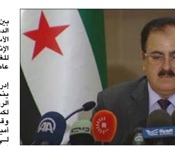
اللواء سليم إدريس خلال مؤتمره الصحفي في تركيا أمس

عواصم - وكالات: أيدى الجيش السوري الحر رفضه الشديد للاتفاق حول جدول نزع السلاح الكيماوي السوري، متهمًا الرئيس الروسي فلاديمير بوتين ووزير خارجيته سيرغي لافروف بتلقي رشاوى من رامي مخلوف، ابن خال الرئيس السوري بشار الأسد. وقال رئيس هيئة أركان الجيش الحر اللواء سليم إدريس في مؤتمر صحافي بإسطنبول إنه «يمكك الدليل على ما يقول ومن يريد الحصول عليه عليه أن يزوره في مكتبه»، واصفا الرئيس الروسي ووزير خارجيته بـ «الإرهابيين». وعبر الجيش السوري الحر صراحة عن رفض الاتفاق الأميركي - الروسي والتعهد بالعمل على إسقاط الأسد، مؤكدا استمراره في القتال ضد نظام بشار الأسد. كما أعلن اللواء سليم إدريس عدم قبول الجيش الحر بالمشاركة في مفاوضات جنيف ما لم يتم