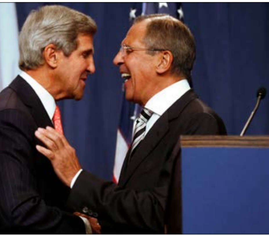
وزير الخارجية الأميركي جون كيري ونظيره الروسي سيرغي لافروف عقب محادثات جنيف 2

وقال لافروف في جنيف «في حال عدم احترام (دمشق) للشروط (في إطار اتفاق حظر الأسلحة الكيماوية) أو في حال استخدام الأسلحة الكيماوية من أي جهة كانت، فإن مجلس الأمن الدولي سيخضع لتدابير في إطار الفصل السابع» من ميثاق الأمم المتحدة والذي يجيز استخدام القوة. من جانبه، قال لافروف إنه تم التوصل إلى وثيقة حول التخلص من الأسلحة الكيماوية في سورية خلال وقت وجيز. وشدد لافروف على ضرورة تجنب السيناريو العسكري الذي سيؤدي للمنطقة، ويضع العلاقات الدولية على شفاهاوية. وأبان أن الوثيقة التي تم إقرارها حول التخلص من كيماوي سورية تحتاج إلى آليات عمل من خلال مجلس الأمن الدولي. وحول الجهود الدبلوماسية لتسوية الأزمة السورية، قال وزير الخارجية الروسي إنه يجب على المعارضة السورية أن تكون مستعدة للمشاركة في مؤتمر «جنيف 2»، والذي نسعى لعقده خلال الشهر الجاري، ولكنه ربما يتأجل للشهر المقبل. وأفاد بأن التخلص من الأسلحة الكيماوية في سورية خطوة نحو التخلص من أسلحة الدمار الشامل في منطقة الشرق الأوسط