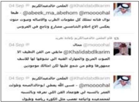
تغريدات خالد عبدالكريم التي هاجم فيها فنان العرب وأحلام