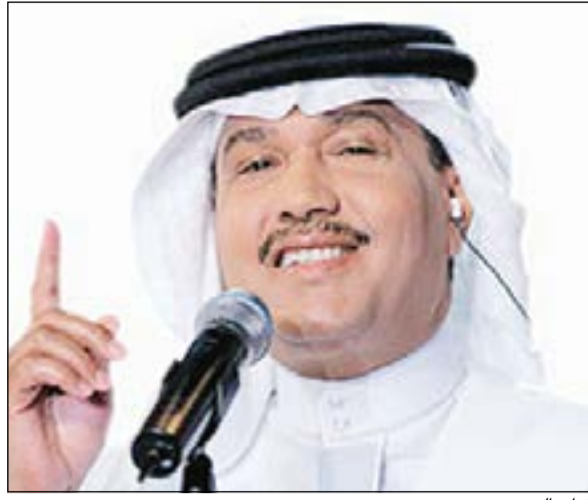
فنان العرب محمد عبده