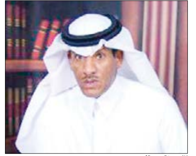
الملحن خالد عبدالكريم

«الأبناء» رصدت تغريداته بعد الهجوم عليه من محبي فنان العرب