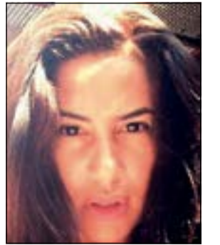
هند صبري بدون اي مكياج

انضمت الممثلة هند صبري إلى النجوم المنضمين لحساب «انستغرام» على الإنترنت وبدأت في نشر العديد من الصور لها على حسابها الجديد ومن بين هذه الصور صورة لها بدون مكياج. وانتظرت الممثلة التونسية رواد فعل جمهورها على هذه الصورة التي نالت استحسان الكثيرين في حين نالت عدم إعجاب البعض الآخر. وكانت صبري قد نشرت صورة أخرى لابتناسمتها بدون مكياج، وعلقت عليها قائلة: «بدون مكياج.. طبيعي».