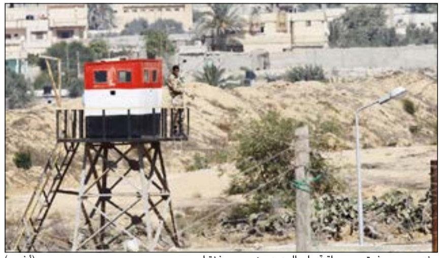
جندي مصري فوق برج مراقبة على الحدود بين مصر وغزة امس

من دون أن تدخلها الجهة الفلسطينية من الحدود، في حين نفت حكومة حماس هذا الأمر.