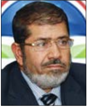
د. محمد مرسي