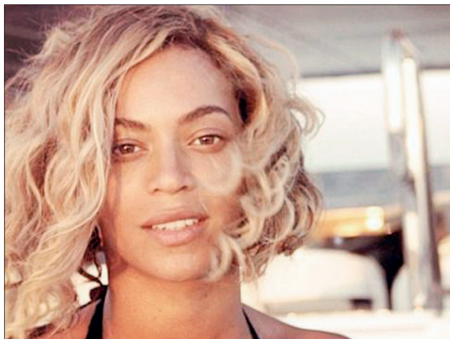
بيونسيه بدون مكياج

نشرت النجمة بيونسيه مجموعة من الصور لها على صفحتها الخاصة على أحد مواقع التواصل الاجتماعي، وهذه الصور التقطت خلال رحلة بيونسيه مع زوجها النجم جاي زي وابنتها