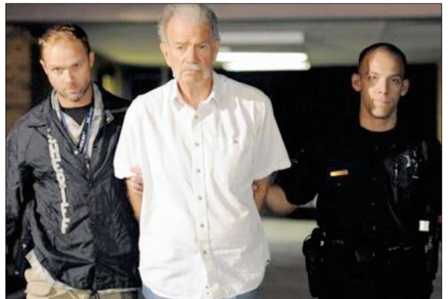
تيري جونز لحظة القبض عليه

لندن - العربية: اعتقلت شرطة فلوريدا بالولايات المتحدة الأمريكية القس المتطرف تيري جونز «حارق المصاحف» الشهير، وهو في سيارة محملة بنسخ من الكتاب الكريم كان متجهاً بها أول من أمس إلى حديقة بولاية فلوريدا، للقيام بما يمكن تسميته «محرقة قرآنية» خطط ليحرق فيها 2998 مصحفاً، انتقاماً منه لقتلي سقطوا بهذا العدد في مركز التجارة الدولي يوم تفجيرات 11 سبتمبر 2001 بنويويورك.