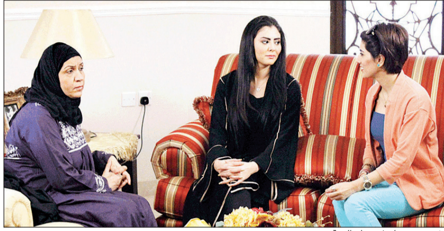
مشهد من مسلسل «عطر الجنة»

وأى الأعمال تابع، رد: لن أنكر اسم مسلسل لكن بالاجمال هناك أعمال قوية حظيت بمتابعة كبيرة وأخرى دون المستوى ولم تحقق النجاح المرجو، ملمحا إلى أن كلام البعض أن الدراما الخليجية هذا السنة ضعيفة «أسطوانة» سنوية تقال عقب كل موسم رمضاني، مشددا على أن الدراما الخليجية أثبتت نفسها وقدرتها على المنافسة مع الدرامات العربية الأخرى، مكملا: مسلسلاتنا الآن هي المسيطرة عربياً في ظل الأحداث التي تشهدها بعض البلدان في منطقتنا، وهذه فرصة يجب أن نغتنمها لكي نكسب مساحة