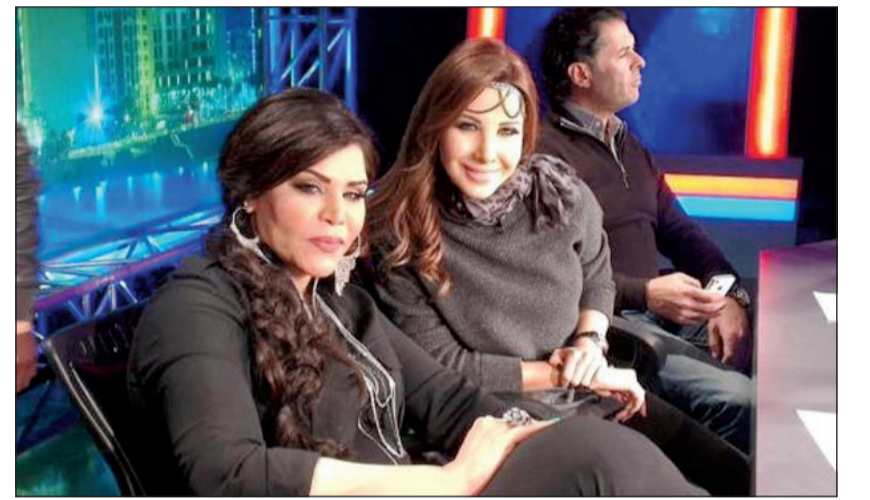
أحلام ونانسي عجرم

زادت عليها، حسب موقع «دنيا الوطن»، جائزة مالية كبيرة للفائز، إضافة إلى مشاركته في إخراج الكليب. ووجدت أحلام استجابة واسعة من جمهورها خاصة أنها تعد واحدة من أكثر النجمات العربيات متابعه على مواقع التواصل الاجتماعي.