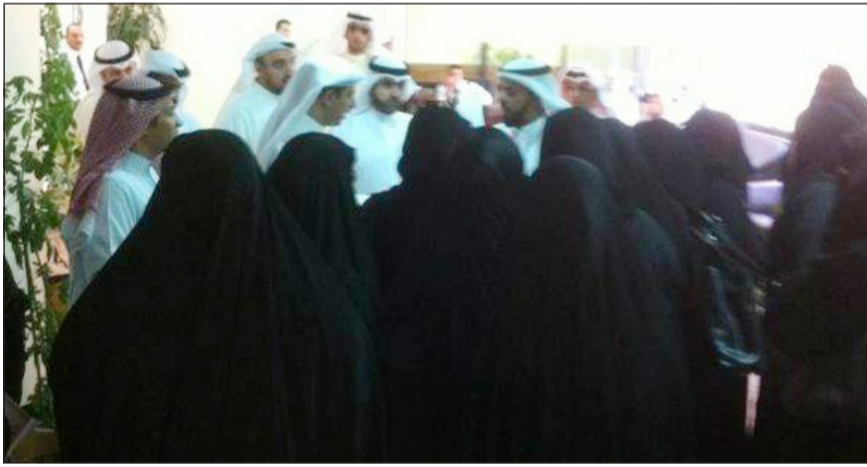
جانب من اعتصام رؤساء ورئيسات الاقسام

اعتصم مجدداً امس رؤساء ورئيسات اقسام المواد الدراسية احتجاجاً على إلزامهم بتدريس فصل من المرحلة الابتدائية، كما جاء في وثيقة «الابتدائي» الجديدة، حيث تواجدوا أمام مكتب وزير التربية ووزير التعليم العالي د.نائب الحجر الا ان اعتصامهم هذه المرة سادته الفوضى، رغم ان مكتب الوزير وعدمه بان كتابهم سيعرض على الحجر مطلع الأسبوع المقبل للبت فيه، غير ان ذلك لم يرق لهم وعبروا عن عدم ثقتهم في هذه الإجراءات، وحسب معتبرين انها وحسب وصفهم (تصريفية). وقدموا كتاباً مرة أخرى حول القرار الذي ينص على استناد فصل دراسي لرئيس القسم في المواد الأساسية، حيث أوضحوا في الكتاب ان هذا القرار يعيد عبء التدريس لرئيس القسم والذي له من المسؤوليات والتبعات التي تتراخي يوماً بعد يوم في تطوير التعليم، وكذلك البرامج التي يقوم بها داخل وخارج المدرسة، والتي تتعلق بالتنميط والمعلم والمنهج والمبنى المدرسي. وتطرقوا الى المهام التي يقوم بها رئيس القسم والتي تحتاج الى تركيز أكثر مطالبين التربية بإلغاء القرار والعودة الى النظام السابق في مهام عمل رئيس القسم. قائلين ان هذا القرار سيعود بأثار سلبية على المخرجات التعليمية نتيجة لعدم تفرغ رئيس القسم للقيام بواجباته المنوط بها ولا يمكننا الجمع