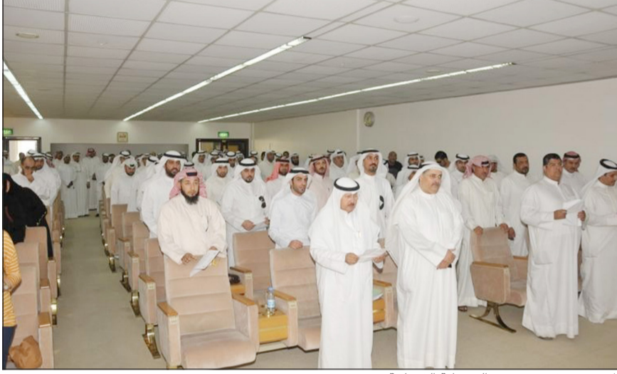
المفتشون بقسمون بين الضبطية القضائية

وتبين الإحصائيات أن عدد العمال الذين تحول رواتبهم إلى أحد البنوك المحلية 300 ألف عامل شهريا لعدد يزيد عن 14 ألف صاحب عمل تنفيذاً لأحكام المادة 57 من قانون العمل