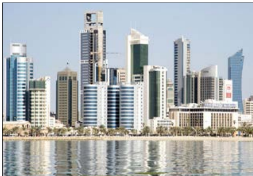
انخفاض التداول على العقارات الخاصة والاستثمارية وارتفاع العقارات التجارية خلال النصف الأول من العام الحالي