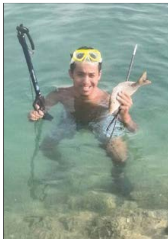
صيد الشعري على الاسياف