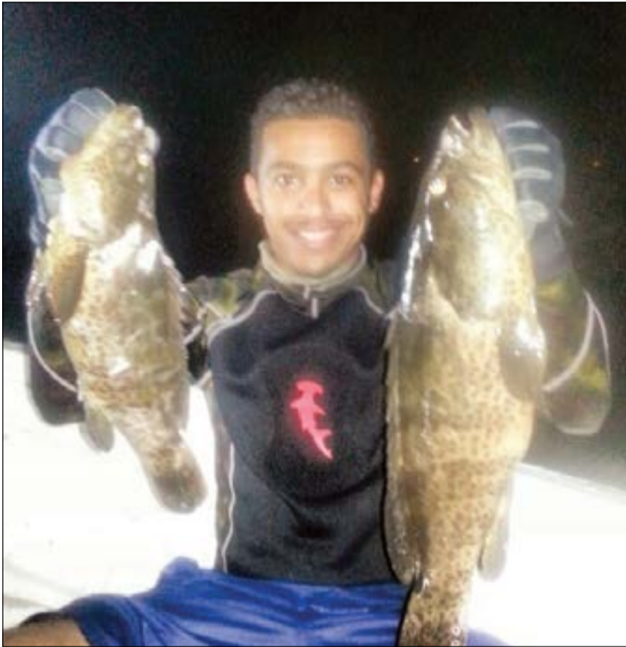
هذا الصيد الصبح بواليل

● رسالتي الأخيرة أقولها لكل مرتادي البحر بان يهتموا بعودة السلامة والإسعافات الأولية كاملة دون نقصان، وأيضا أشجع الشباب على ممارسة الغوص الحر وتعلمه لما فيه من الفوائد الكثيرة، وفي الختام أدعو للجميع بالسلامة.