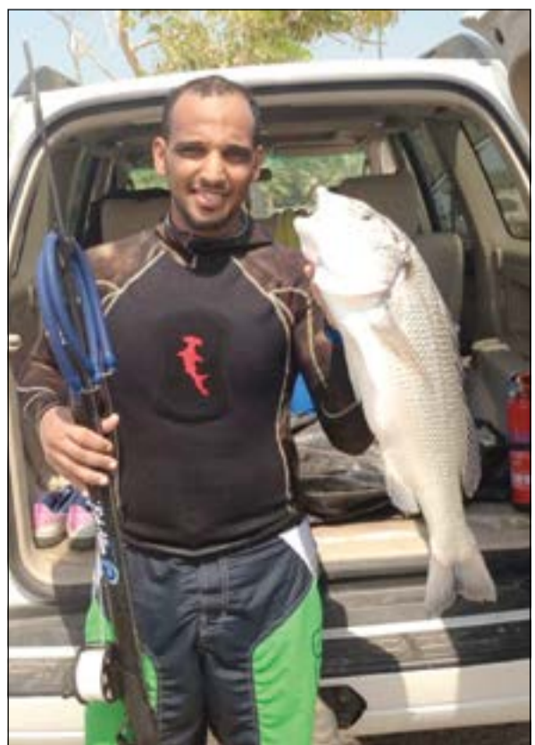
السيطي مايسلم من المسدس البحري

● صدقني اغلب المحاذق والاقواع اصبحت ناشقة ما فيها شيء، والاسباب التي ادت