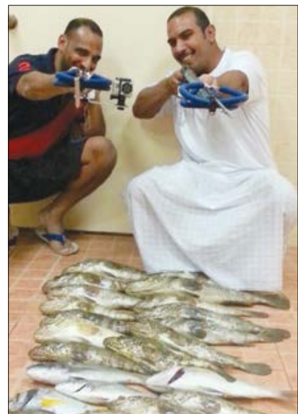
اللي يتحدى هذا صيدنا