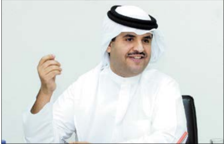
الشيخ دعيج الخليفة

في إطار استعداداته للموسم الدرامي المقبل يواصل الشاعر الشيخ دعيج الخليفة كتابة عدد من الأعمال الدرامية التي ستسرى النور قريبا، ومنها مسلسل «لحب كلمة» من إنتاج باسم عبدالامير وتاليف فهد العليوية وبطولة نخبة من نجوم الكويت والخليج، وسيتم تصويره في غناء هذه المقدمة المطربة شمس الكويتية في تعاون ينتظره كثير من عشاق الخليفة، وتدور أحداث المسلسل في إطار اجتماعي رومانسي مليء بالتشويق حول الحب وكيف يؤثر على حياتنا وعلاقاتنا بالمحيطين بنا.