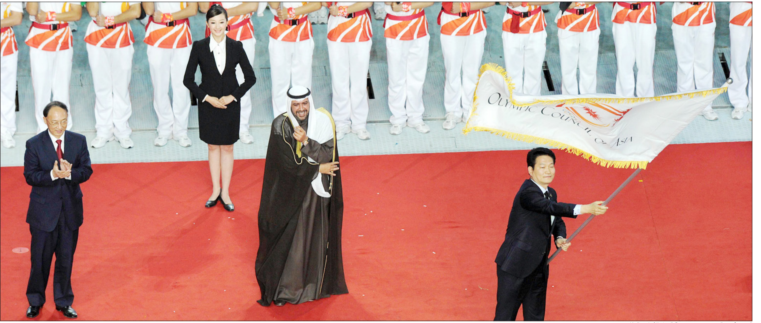
الشيخ أحمد الفهد يقف في مقدمة العمل الأولي العالمي