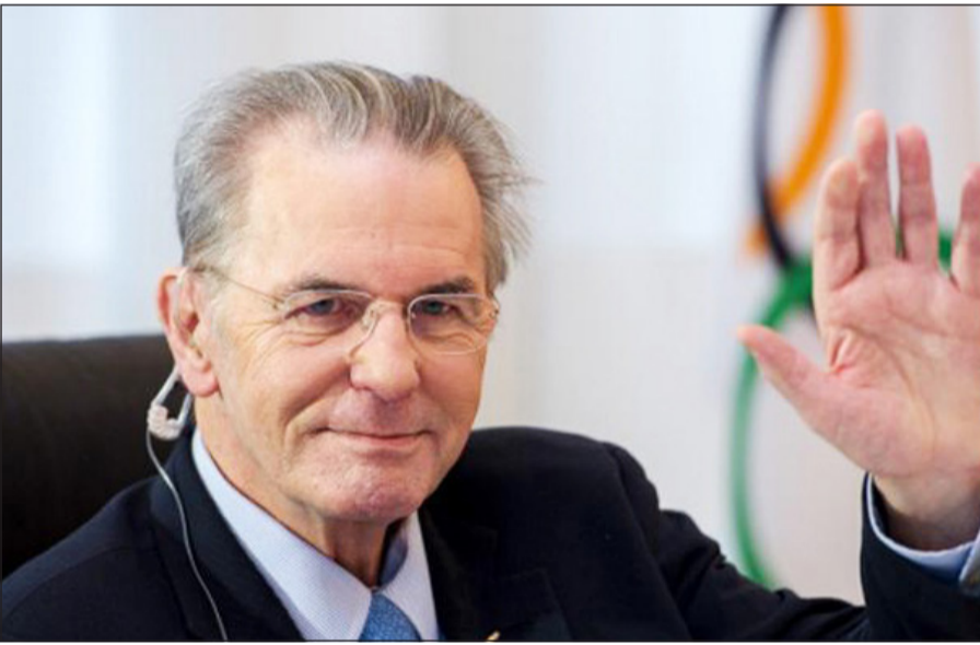
جاك روغ .. والتحية الأخيرة

وأضاف: «في حال وصول توماس باخ إلى الرئاسة يكون قد اكتمل المثلث الذي تحدث عنه الشيخ أحمد الفهد قبل عامين في رؤيته لمستقبل الحركة الأولمبية، هذا المثلث يشمل رئاسة انوك (اتحاد اللجان الأولمبية الوطنية)، وقمة الهرم في رئاسة اللجنة الأولمبية الدولية، ورئاسة منظمة الاتحادات الرياضية الدولية التي تولاهما النمساوي ماريوس فايزر». وكان الفهد دعم فايزر رئيس الاتحاد الدولي للجودو في انتخابات سبورت أكورد منظمة الاتحادات الرياضية الدولية» بصحولة على 52 صوتاً مقابل 37 لفرنسي برنار لاباسيت رئيس الاتحاد الدولي للركبي المدعوم من رئيس اللجنة الأولمبية الدولية المنتهية ولايته جاك روغ.