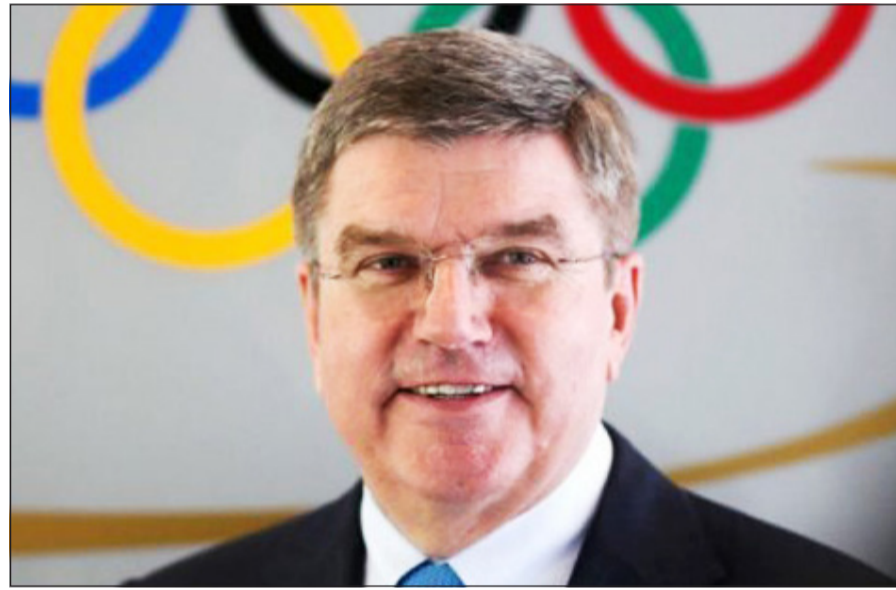
الألماني توماس باخ الأوفر حظاً بالفوز

ترشيحها لاستضافة اولمبياد 2024. وألحت الصحف التركية التي صدرت أمس إلى «حسابات» أوروبية، بتفضيل مدينة آسيوية على اسطنبول في التصويت.