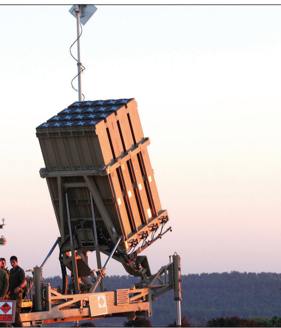
أحدى بطاريات صواريخ القبة الحديدية الإسرائيلية التي نشرتها قرب القدس المحتلة

واتهم عبدربه إسرائيل «بالعمل من أجل الاستفادة من المفاوضات لتحقيق أهداف أخرى مثل محاولة التأثير على الموقف