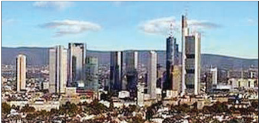
فرانكفورت موطن لخمس ناطحات سحاب

أصبحت فرانكفورت حديثا من أهم المدن الأوروبية، حيث تعتبر موطناً لخمس ناطحات سحاب يبلغ طول كل منها أكثر من 200 متر. وهي تعتبر بمنزلة خليط مميز للمباني