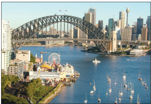
سيدني الجميلة بمنزلة معرض لأستراليا

وتعد سيدني من أحد أبرز المدن السياحية والجميلة حيث أنها تجمع بين جمال الطبيعة الخلابة والحياة العصرية المتطورة والجميل أيضا أنك ستواجه العديد من الثقافات والجنسيات المختلفة وعدم وجود العنصرية. فالشعب في هذه المدينة متعاطف مع الكل ويساعد من السياح والغرباء. ويوجد الكثير من المسلمين فيها مما يسهل تعايش المسلم فيها من ناحية الصلاة والأكل الحلال ولبس الحجاب للمرأة. تقع مدينة سيدني في