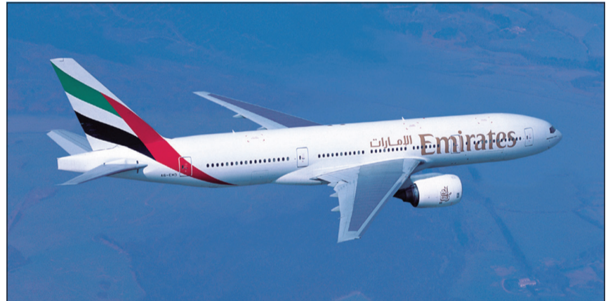
تشغل طيران الإمارات طائرة بوينغ 200ER-777 بتوزيع الدرجات الثلاث لخدمة العاصمة الليبية

والدرجة السياحية)، وتتم الرحلات عبر التوقف في مالطا.