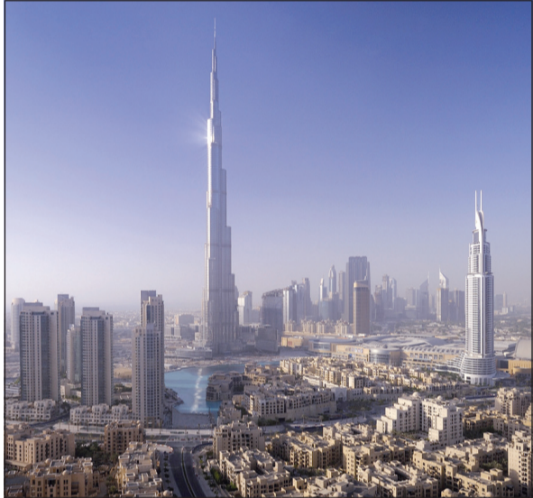
دبي موطن لناطحات السحاب السكنية والمباني الإبداعية للفنادق

وتضم دبي أكبر مشروع استثماري في إمارة دبي وهو جزيرة النخيل وهو واحد من المشاريع العمرانية السياحية العملاقة. هذا بالإضافة إلى مطار دبي الدولي وهو واحد من أجمل وأكبر المطارات بالمنطقة حيث تعمل حكومة دبي على إحداث نقلة نوعية لمفهوم السفر والسياحة من خلال التوسعات الكبيرة في المطار وكذلك التوسع العمراني الكبير والعمل على أن تكون مدينة دبي من أهم المزارات على خارطة العالمية للسياحة ومن أشهر الميادين في دبي وهو ميدان الساعة أو دوار الساعة