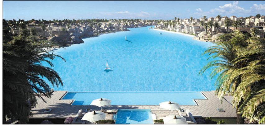
شرم الشيخ المدينة السياحية الأجل في العالم