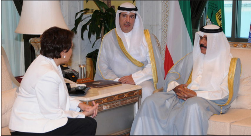
سمو نائب الأمير وولي العهد الشيخ نواف الأحمد مستقبلا وزيرة خارجية هندوراس

استقبل سمو نائب الأمير وولي العهد الشيخ نواف الأحمد في ديوانه بقصر السيف صباح أمس نائب رئيس مجلس الوزراء ووزير الخارجية الشيخ صباح الخالد ووزيرة خارجية جمهورية هندوراس الصديقة ميريا اغيرو كوراليس والوفد المرافق لها وذلك بمناسبة زيارتها للبلاد، حيث سلمت سموه رسالة خطية من رئيس جمهورية هندوراس بورفيريو لوبو سوسا إلى صاحب السمو