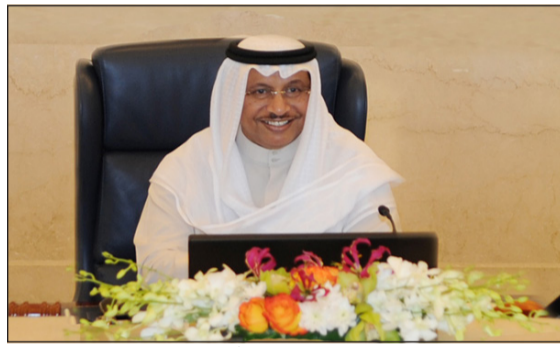
سمو رئيس مجلس الوزراء مترئسا جلسة أمس

اعتزازه بما يشهده التعاون المشترك بين الكويت والولايات المتحدة الأميركية من تقدم ونمو تحقيقا لما فيه خير الشعبين الصديقين انطلاقا من علاقات الصداقة المتميزة بين قيادتي وشعبي البلدين الصديقين. ثم تدارس المجلس توصية لجنة الخدمات العامة بشأن الاقتراح المقدم من وزارة الأشغال العامة بتشكيل لجنة مشتركة لمتابعة بعض المشاريع في جزيرة بوبيان ومدينة الحرير، ونظرا لكون هذا المشروع من المشاريع الاستراتيجية الرائدة قرر المجلس الموافقة على تشكيل لجنة برئاسة وزارة الأشغال الأمريكية يوم الجمعة المقبل وذلك في إطار البرنامج المشترك بين الكويت والولايات المتحدة الأمريكية يوم الجمعة المقبل الذي تم الاتفاق عليه بين البلدين الصديقين. وقد أكد مجلس الوزراء على أهمية هذا اللقاء ولا سيما في ظل الظروف الإقليمية والدولية السائدة وما سيترتب من فرص لتبادل وجهات النظر حول أوجه تطوير التعاون والقضايا الأخرى موضع الاهتمام المشترك، معربا عن