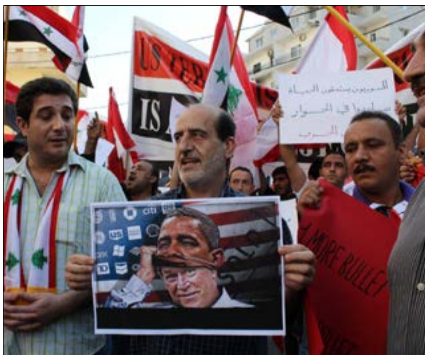
اعتصام لشباب من 8 آذار أمام السفارة الأميركية في عوكر احتجاجا على الضربة العتمة لسورية

وفي تقرير استخباراتي اوروبي بثته اذاعة «لبنان الحر» ان حزب الله لا يملك الرد على الضربة الأميركية من داخل الأراضي اللبنانية، لان هذا القرار مرهون بالحرس الثوري الإيراني الذي يعمل على خط مواز للإدارة السياسية برئاسة الرئيس الإيراني روحاني الراغب بتسويات مع المغرب. وأضاف التقرير ان الحزب الذي يحتاط لحمل