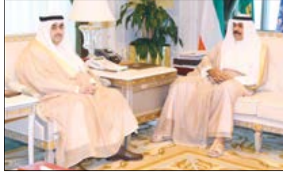
..وسموه مستقبلاً سفيرنا لدى النمسا صادق معرفي