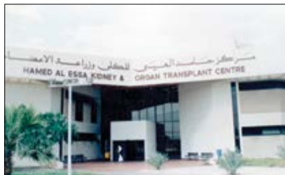
مبنى مركز حامد العيسى