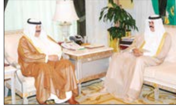
سمو نائب الأمير مستقبلاً وكيل وزارة الخارجية السفير خالد الجارالله

استقبل سمو نائب الأمير وولي العهد الشيخ نواف الأحمد في ديوانه بقصر السيف صباح أمس رئيس مجلس الأمة مرزوق الغانم واستقبل سموه بقصر السيف صباح أمس سمو رئيس مجلس الوزراء الشيخ جابر المبارك.