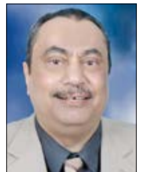
د. خالد السهلاوي

من أجل كل ذلك تناشده الوافدة بعد كل هذه المعاناة مجلس الوزراء الموافقة على سفر زوجها للعلاج بالخارج، كما تتوجه بطلب إلى وكيل وزارة الصحة د.خالد السهلاوي حتى يتم فتح تحقيق مع مسؤولي مركز حامد العيسى لزراعة الكلى في موضوع تدهور حالة زوجها الصحية ومن المسؤول عنها، ومنا إلى المسؤولين «البيانات لدي الأنباء»