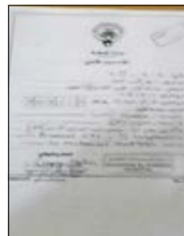
تقرير مستشفى مبارك