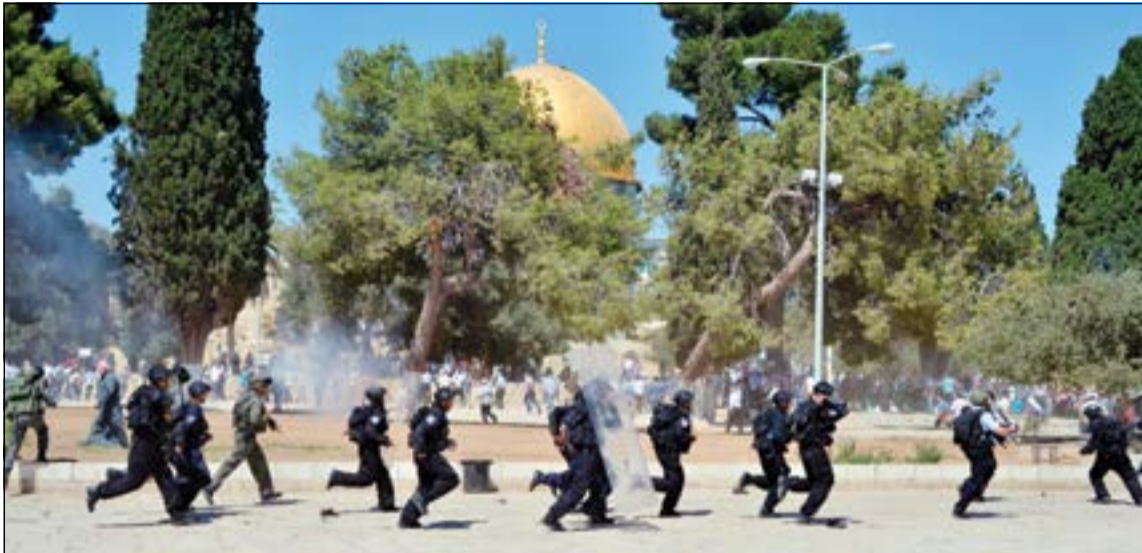
قوات الاحتلال خلال تعقبها المصلين الفلسطينيين ببيحة المسجد الأقصى أمس الأول

بأجاء مستوطنة «معاليه أنوميم» والبحر الميت. وفي سياق آخر، دعت دائرة الثقافة والإعلام في منظمة التحرير الفلسطينية إلى رفع الحصانة القانونية والسياسية عن إسرائيل واتخاذ التدابير الجديدة لمحاسبتها في الهيئات والمحاكم الدولية على خرقاتها وجرائمها. واعتبرت الدائرة في بيان صحافي أمس أن الاستفزاز الإسرائيلي المتواصل باقتحام المسجد الأقصى والاعتداء على الأماكن المقدسة «افتعال مدروس لاستدراج الشعب