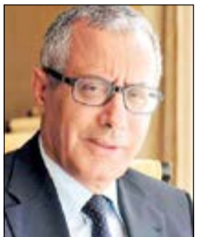
د. علي زيدان

القاهرة - وكالات: اندلعت أزمة سياسية حادة بين جماعة الإخوان المسلمين في ليبيا والحكومة الانتقالية التي يترأسها د. علي زيدان، على خلفية زيارته الأخيرة لمصر وسط معلومات عن اعتزام حزب العدالة والبناء، الذراع السياسية للحكومة احتجاجاً على سياسات زيدان في الداخل، واجتماعه في القاهرة مع كبار المسؤولين المصريين، وخاصة الفريق أول عبد الفتاح السيسي نائب رئيس الوزراء ووزير الدفاع والقائد العام للقوات المسلحة المصرية. وأقادت مصادر من المكتب السياسي لحزب العدالة والبناء الليبي سيجتمع بقيادة رئيسه محمد صوان لاتخاذ قرار نهائي يحسم مستقبل الحزب داخل الحكومة الائتلافية، التي يترأسها د. زيدان منذ شهر